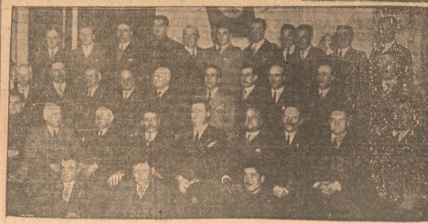
ASISTENTES AL BANQUETE EN EL CLUB ITALIANO