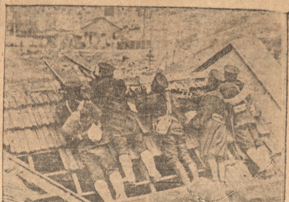
Patrulla de Infantería japonesa observa los movimientos de tropas chinas.