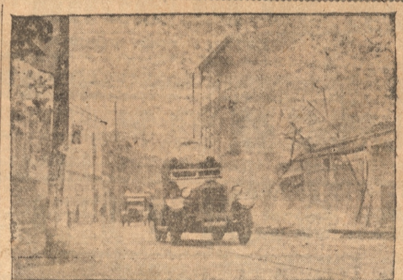
Camiones del Ejército japonés llegando a Chapel.

calles apolonándose como una manada de pavos. Agujoneándose con las puntas de sus bayonetas van unos cuantos soldados japoneses. Entre el grupo hay uno que lleva una bandera japonesa. El chino, de cuando en cuando, inclina la bandera del Sol Naciente hasta llevarla casi abatida, y entonces un soldado japonés le pica en la espalda con su bayoneta para que la vuelva a llevar enhiesta y