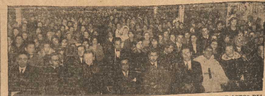
VISTA OBTENIDA EN EL DESARROLLO DE LA VELADA EN EL SALON DE ACTOS DEL COLEGIO

El banquete de medio día.— La velada en los salones del colegio, alcanzó gran lucimiento