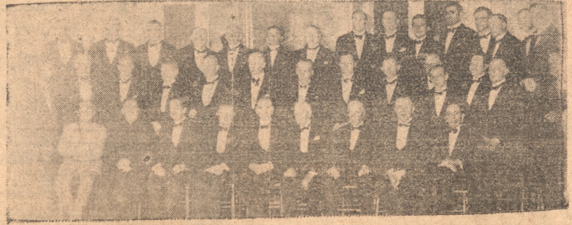
LOS ASISTENTES A LA COMIDA DE ANOCHE EN EL CLUB ALEMAN

Los asistentes a la comida de anoche en el Club Alemán.