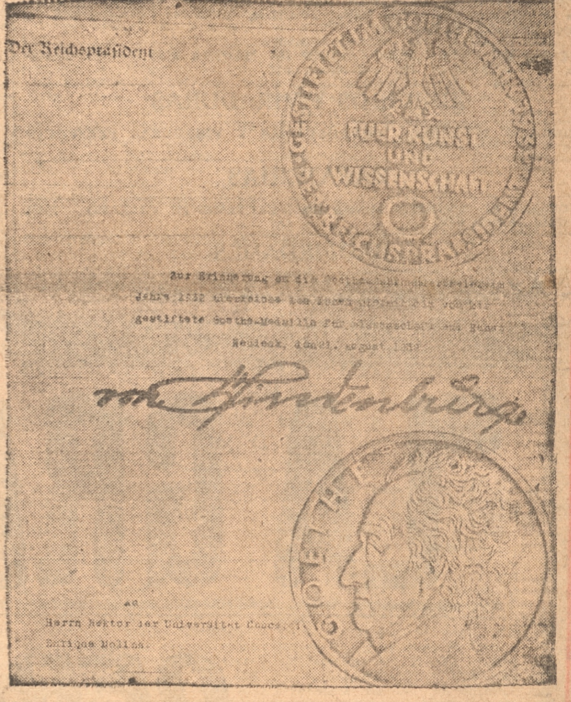
Anverso y reverso de la medalla de Goethe y el documento firmado por Von Hindenburg