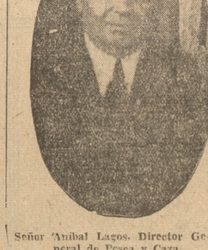
Señor Anibal Lagos, Director General de Pesca y Caza

Expresó que para solucionar este problema hay necesidad de construir frigoríficos en los principales centros pesqueros del país, contar con carros frigoríficos en los ferrocarriles y con establecimientos destinados a su almace-