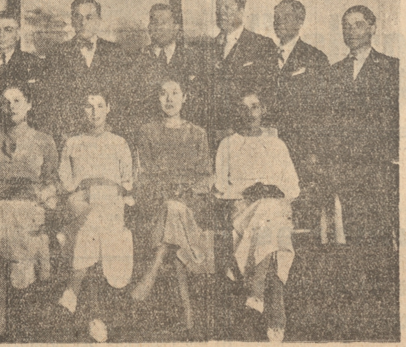
MIEMBROS DEL COMITE EJECUTIVO Y LA REINA CON SU CORTE DE HONOR

Humildes como son los pescadores, llevan sobre sí la aureola de una gloriosa tradición: la de haber recibido las enseñanzas de Aquel que amara, y eligieran como discípulo, para proseguir y difundir en el mundo, las sublimes