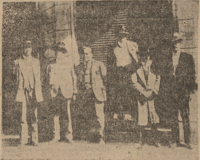
LOS AUTORES DEL INCENDIO EN COMPANIA DE LOS AGENTES QUE LOS APREHENDIERON

En el subterráneo había numerosas latas vacías amontonadas, y fue colgando las tripalpas a diversas alturas, colocándose pedazos de madera, para establecer uniones.