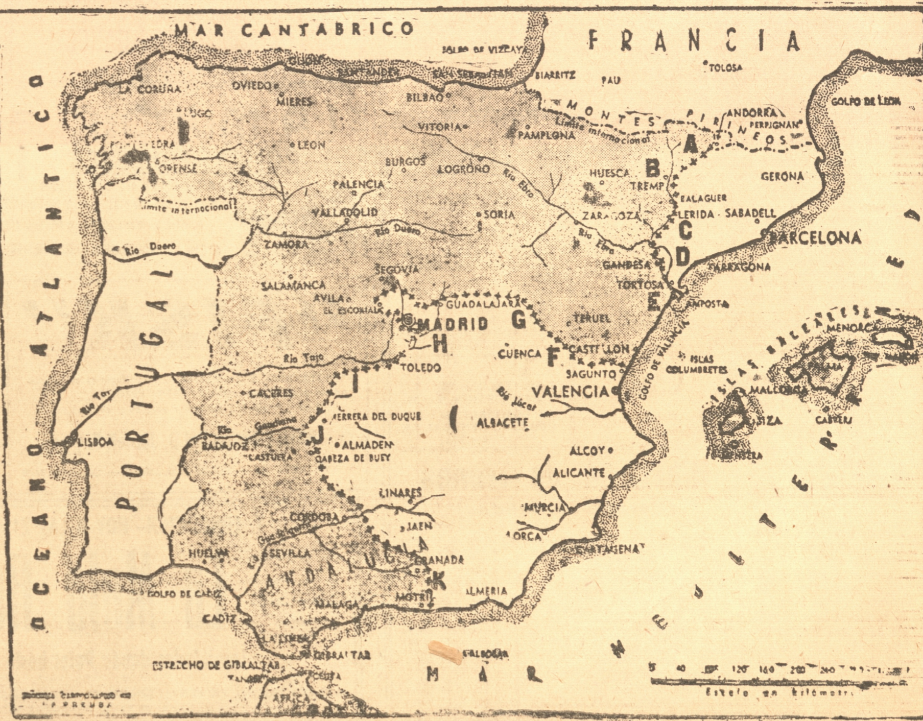
EN ESTE MAPA PUEDE VERSE CLARAMENTE LA SITUACION DE LOS FRENTE ESPAÑOLES EN ESTOS ULTIMOS DIAS Y LA PARTE QUE DOMINAN TANTO LOS NACIONALISTAS COMO LOS REPUBLICANOS