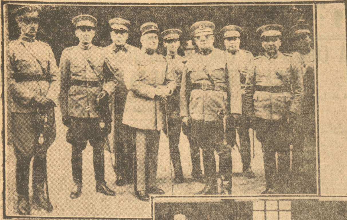
Los señores de Boyve y sus ayudantes en una de sus visitas a la guarnición.

EL COMANDANTE DE BOYVE SE ENCUENTRA EN CONCEPCION