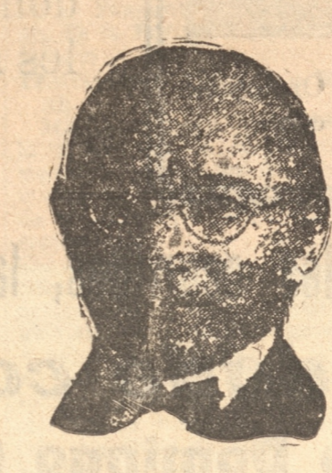
DON MANUEL BARROS CASTAÑÓN, probable Intendente de Valparaíso.