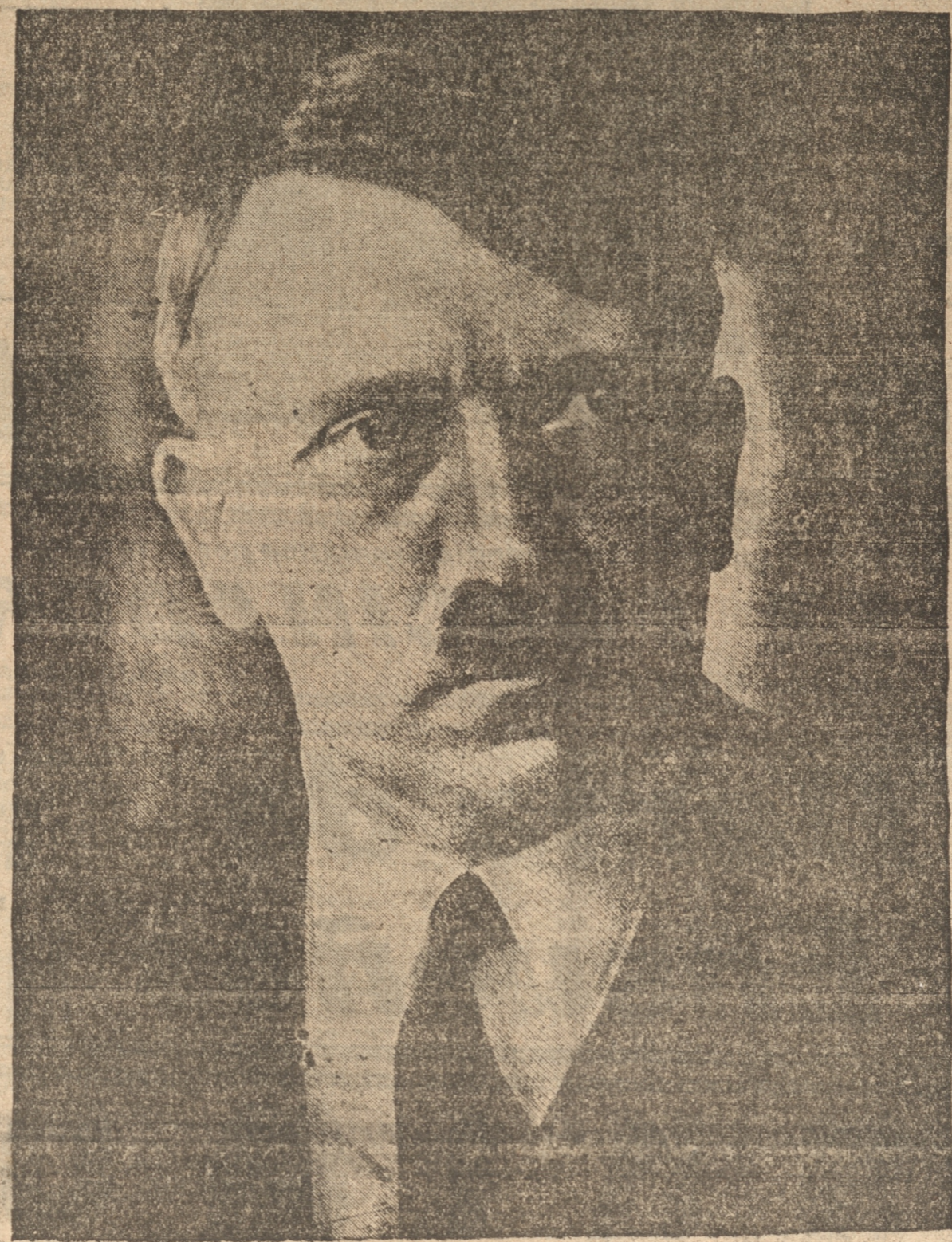
ADOLF HITLER el Fuehrer, con firmado ayer por el electorado de su país como jefe supremo del Reich

Los industriales de panaderías de Antofagasta notificaron al Intendente que desde el 25 del actual clausurarán sus establecimientos, en vista de la imposibilidad de cumplir la disposición que les obliga a vender el pan a $ 1.40 el kilogramo.