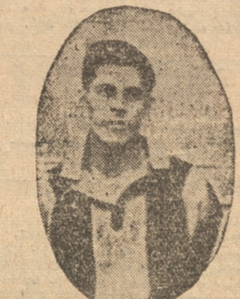
PALMA, scorer de ayer

Fue lógica si la victoria del team militar.— Comentarios y breves detalles