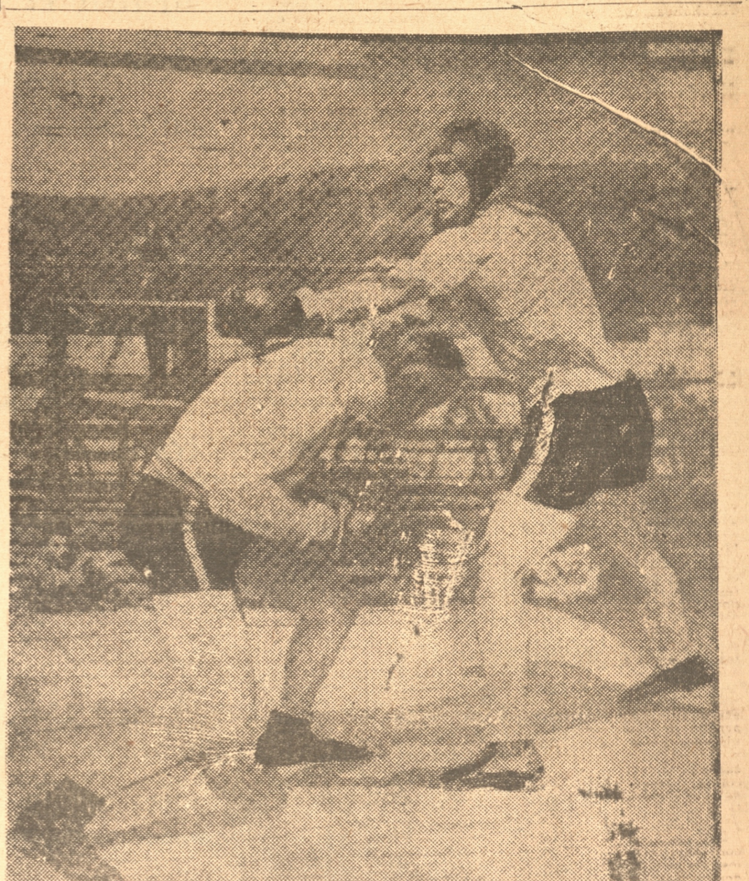
Aquí tenemos al alemán Max Schmelling que hoy le dará la revancha al negro yanqui Joe Louis a quien ya ganó por K. O. en 11 rounds. El alemán se ha entrenado firme y cree repetir su triunfo para lograr el cetro del mundo de todos los pesos, cosa esta que sería la única hasta ahora en la historia del box mundial de todas las épocas.