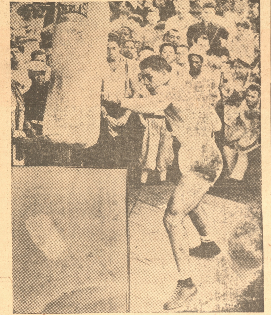
Aquí tenemos una última fotografía del entrenamiento del negro Joe Louis que hoy defenderá el campeonato mundial de box de todos los pesos ante el alemán Schmelling. Louis dijo ayer: "Durante tres años he estado esperando la ocasión de vengar la única derrota denigrante de mi carrera boxerial y mañana (Hoy) la vengaré en forma que no deje lugar a dudas..."