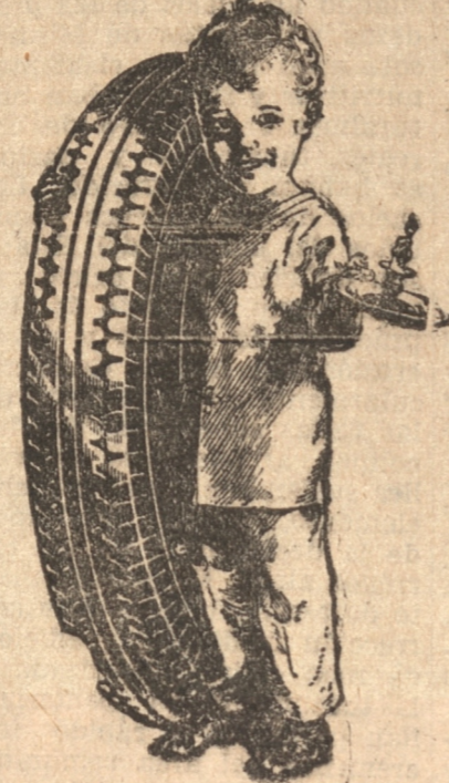
Time To Retire GET A FISK! TRADE MARK REG. U.S. PAT. OFF.

FISK, Mas kilometraje FOR SU Duración, Suavidad y Economía.