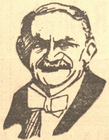
lo que lo preparó para su feliz administración del Ministro-ministrador colonial en Cochinchina y Colonias más tarde.

A principios de 1914 renunció al Ministerio. Al estallar la guerra fue Ministro de Relaciones en el Gabinete de Viviani para entregar el cargo más tarde a M. Declaire en cambio de la cartera de Colonias cuando el Gobierno fue reorganizado como defensor nacional. A la caída del Gabinete en marzo de