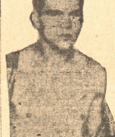
BREMEN, febrero 13. — Schmelling abandonará el 18 de este mes Bremen Haven a bordo del "Europa", dirigiéndose a los Estados Unidos, habien se a bordo ya sus pasajes.