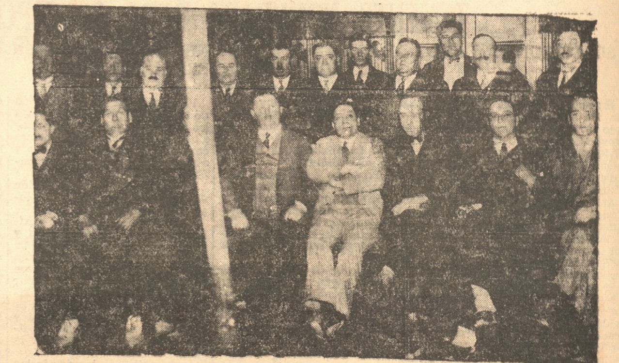
LOS ASISTENTES A LA REUNION DE AYER DE PROPIETARIOS DE RESTAURANTS, BARES Y RAMOS SIMILARES

Acuerdan adherirse al Sindicato en Santiago. — Diversos acuerdos tomados