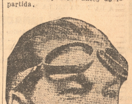
El as argentino Zatuszeck, que llegó 5.º