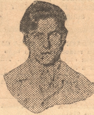
CARU, argentino, que llegó segundo