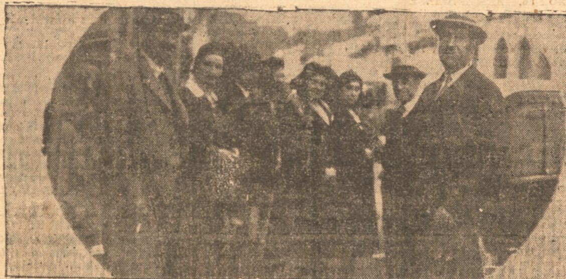
ALGUNOS DE LOS ASISTENTES A LA INAUGURACION DEL PABELLON DE LACTANTES