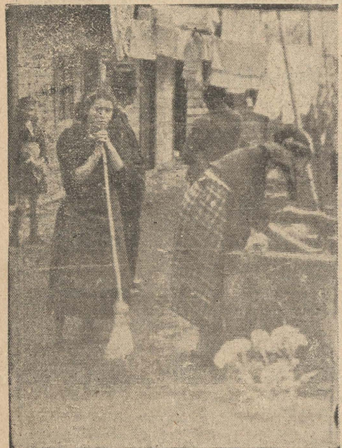
Otro aspecto del conventillo de calle Bulnes 753, que como decimos en esta información aun cuando es mejor que los otros no deja de ser una malísima habitación para obreros.

Prosiguiendo nuestra campaña en favor de los obreros que se ven obligados a llevar una vida miserable en los conventillos, ayer hemos visitado algunos más.