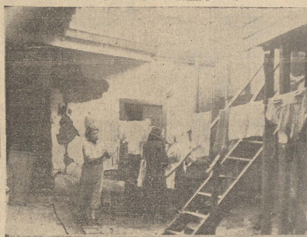
UN ASPECTO DEL PEQUERISIMO PATIO CON QUE CUENTA EL CONVENTILLO DE CALLE ANIBAL PINTO N.º 915

da algunos datos sobre él. Nos dice: Como Uds. pueden observar, este cité se encuentra en muy buen estado, viven aquí más o menos 13 familias, tiene 8 piezas y dos servicios higiénicos comunes. Diganos, señorita, ¿hay luz eléctrica aquí? No señor, cuesta muy cara la instalación. ¿Cuánto paga de arriendo esta gente? Las piezas son aquí de un