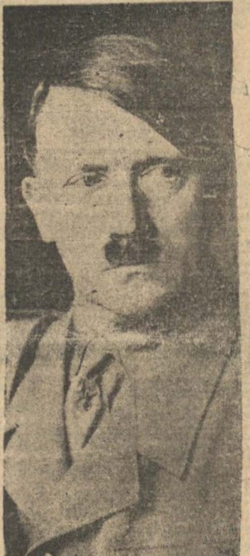
ADOLFO HITLER el Fuehrer, cuyo cumpleaños celebran hoy los alemanes en todo el mundo

BERLIN, 19. — (UP.) — Hace un año las muchedumbres de Berlín estaban de fiesta y se dirigían por la avenida Unter Den Linden y la avenida recién inaugurada "de este y del oeste" que estaba adornada con guirnaldas y luces. Esta noche, vísperas del 51 cumpleaños de Hitler, la ciudad estará a oscuras como de costumbre y los habitantes de Berlín en su mayor parte permanecerán en sus hogares.