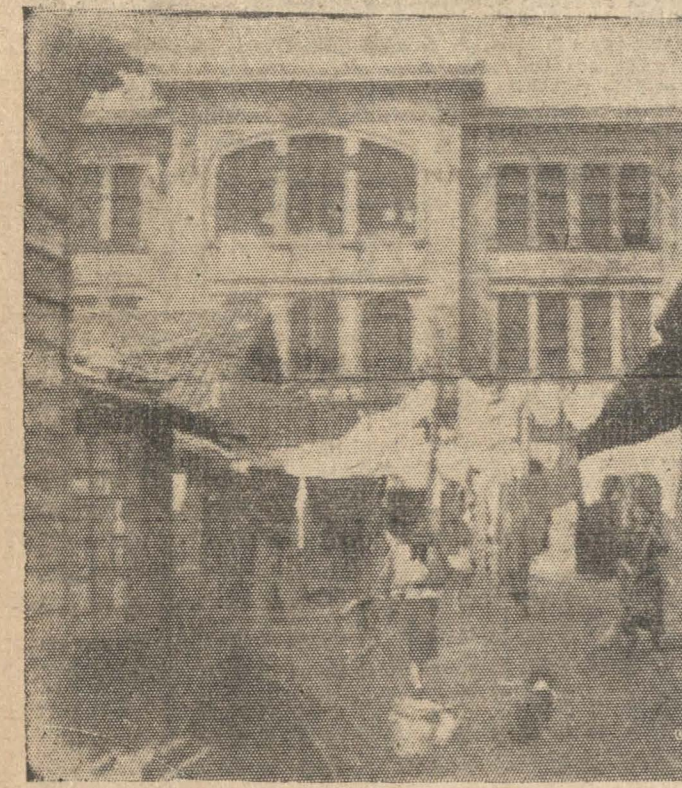
FRENTE AL CONVENTILLO UBICADO EN CALLE BULNES 753 SE ALZA MAJESTUOSA LA ESCUELA BULNES, HACIENDO UN NOTORIO CONTRASTE CON ESTA HABITACION OBRERA

Ante el panorama que se presenta a nuestra vista al visitar estas posilgas en que habitan