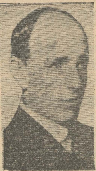
LORD HALIFAX Ministro de Relaciones británico, quien comunicó al Embajador ruso en Londres que el Gob. británico aceptaba en principio entablar negociaciones comerciales con la Unión Soviética

Mc Ewen expresó satisfacción de las declaraciones que al respecto hizo Hull.