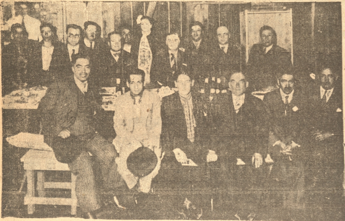
Los asistentes al acto realizado en la tarde de ayer

Simpático acto desarrollado con este motivo