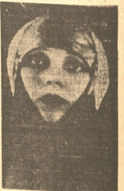
Las localidades como de costumbre se encuentran a la disposición del público en la Confitería Palet, desde las diez de la mañana.

En los recitales que recientemente ha efectuado en el Teatro Municipal de Santiago, los éxitos alcanzados han sido tan fantásticos que, los empresarios, se han visto obligados de firmar con ella nuevos contratos a fin de acceder y corresponder al público que día a día la aplaude y aclama con mayor entusiasmo. Esta ha sido la causa por la cual los recitales anunciados en nuestra ciudad para los días miércoles y jueves próximos se hayan postergado al sábado y domingo respectivamente. Estamos absolutamente seguros de que dado el entusiasmo reinante en todos los círculos sociales y artísticos de la ciudad, la actuación de Raquel Meller en Concepción, va a tener una significación y una resonancia como muy pocas veces hemos tenido oportunidad de presenciar.