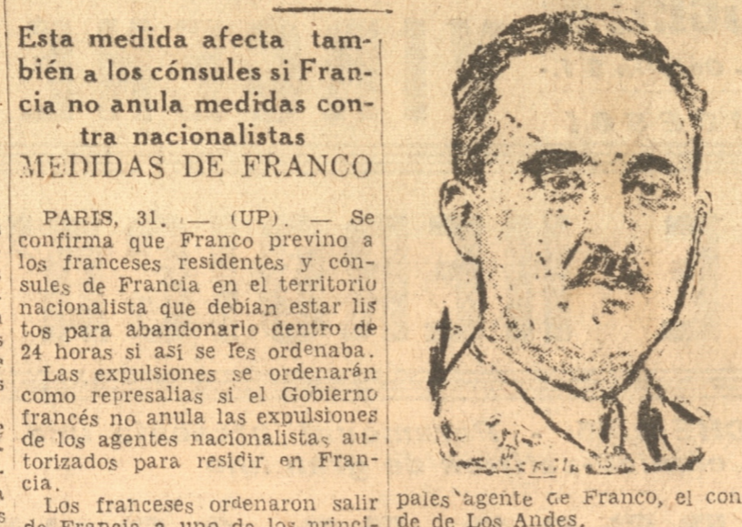
Esta medida afecta también a los consules si Francia no anula medidas contra nacionalistas