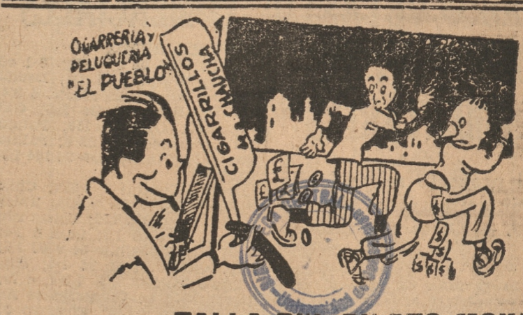
TALLA DEL PILOTO MOYA

OBSERVACIONES: 1. — Las dimensiones fijadas anteriormente son las mínimas, pudiendo permitirse un pequeño aumento a excepción del colchón. 2. — Los precios unitarios se indican a los aspirantes aceptados, una vez que la Dirección de la Escuela apruebe las Propuestas para el aprovisionamiento del Almacén de Ventas.