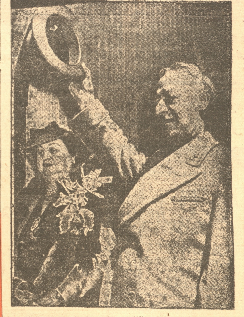
Al Smith, el célebre político católico de los Estados Unidos, saluda desde la cubierta del "Conte Savoia", en que se embarcó recientemente para hacer el primer viaje a Europa en toda su larga vida. El antiguo gobernador de Nueva York, será recibido en audiencia especial por el Papa, y escribirá una serie de interesantes artículos para los principales periódicos del mundo.

El antiguo gobernador de Nueva York, será recibido en audiencia especial por el Papa, y escribirá una serie de interesantes artículos para los principales periódicos del mundo.