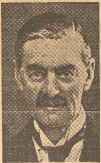
CHAMBERLAIN, el Premier británico, dirigió ayer con emoción su palabra a todo el Imperio

"Cuan horrible, fantástico e increíble es que debamos estar cavando trincheras y entregando máscaras contra gases debido a una querrela en un lejano país", expresó