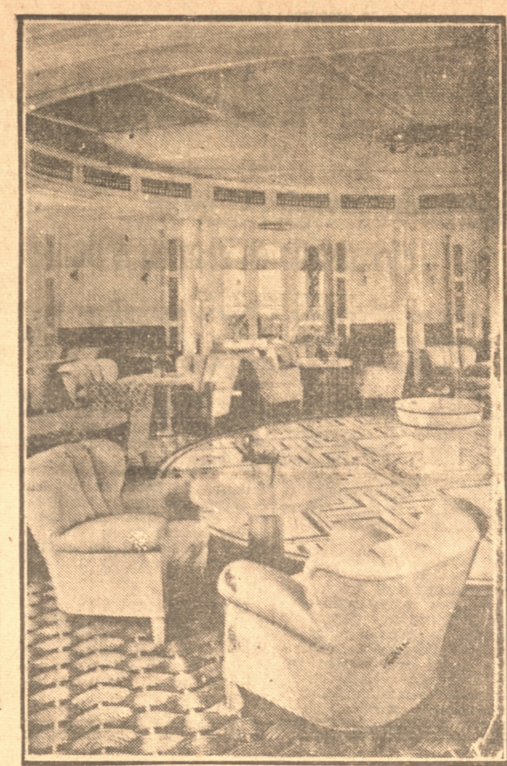
ELEGANTE HALL, EN EL COMPARTIMENTO DE LUJO

mente lleno de público y sus sitios fueron imposible para contener el enorme número de automóviles, teniendo éstos que tomar colocación en la Avenida Blanco Encalada, en donde ocupaban varias cuadras, dándole un regio golpe de vista a esta avenida. 600 turistas y pasajeros A bordo de este lujoso palacio flotante viajan alrededor