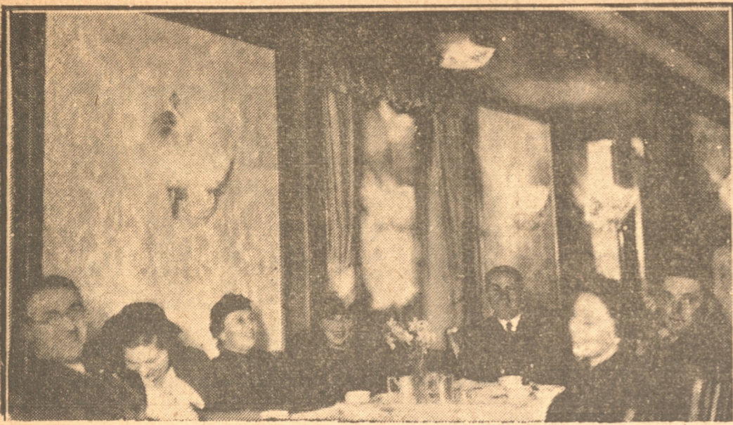
OTRA VISTA DE LA RECEPCION EFECTUADA A BORDO DE LA LUJOSA NAVE.

del Resguardo de la Aduana en donde se vió desde temprano un enorme movimiento y el cual duró hasta las últimas horas de la tarde, a pesar que las horas de visita fueron desde las 10 a 12, teniendo éstas que prolongarse debido a la gran demanda de público que quería acudir a bordo para conocer este hermoso y lujoso transatlántico alemán.