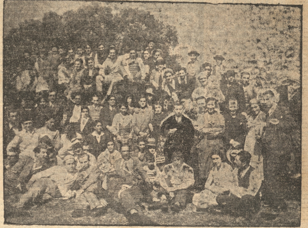
GRUPO GENERAL DE LOS ASISTENTES AL PASEO