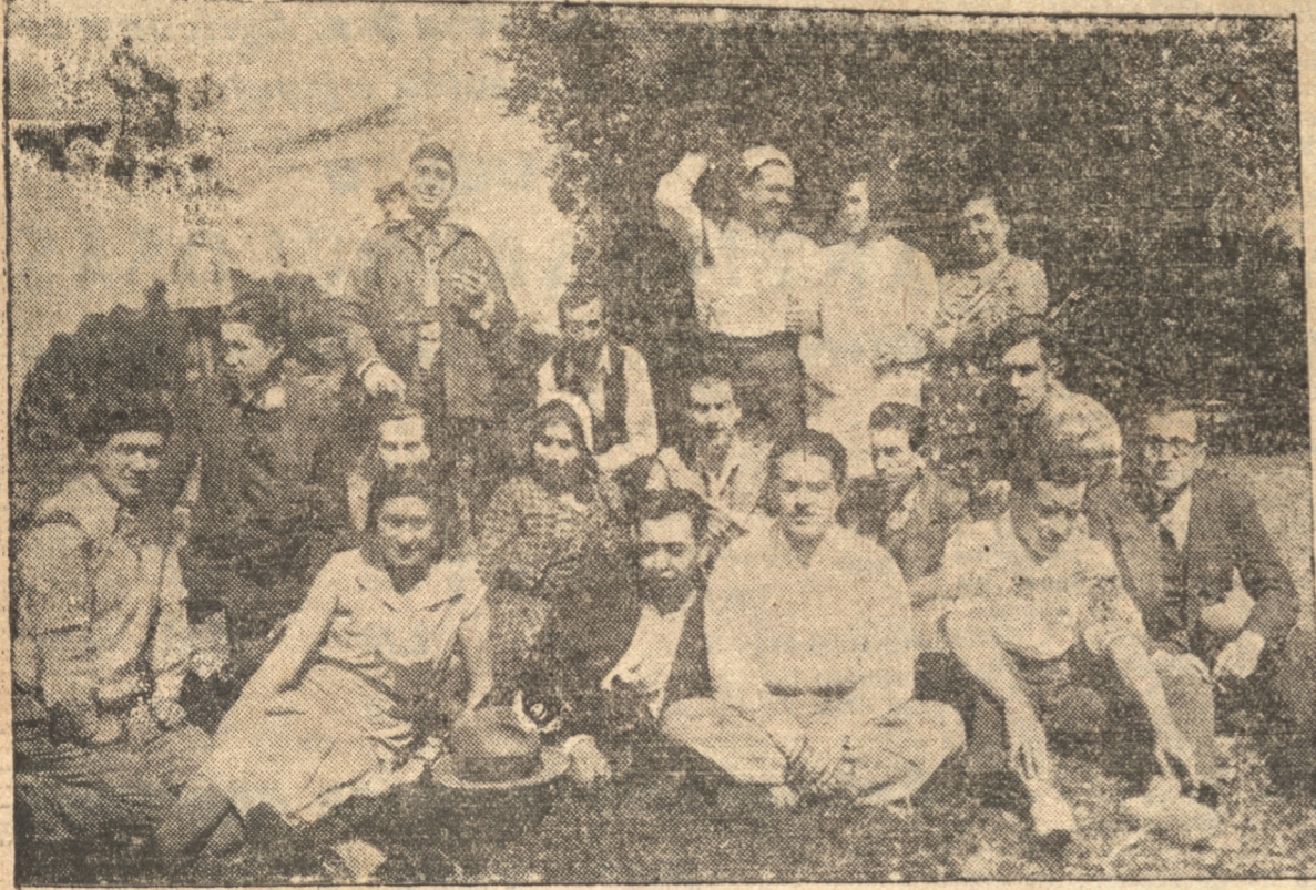
PARTE DEL PERSONAL DE REDACCION Y ADMINISTRACION EN EL PASEO

Inició el regreso de los asistentes al paseo para iniciar las labores que cada uno había tratado de olvidar durante algunas horas. Todo ese día de campo ha dejado gratos recuerdos en los paseantes, quienes por la naturaleza misma de sus labores, casi nunca pueden participar de estas diversiones tan saludables y tan reconfortantes para el espíritu.