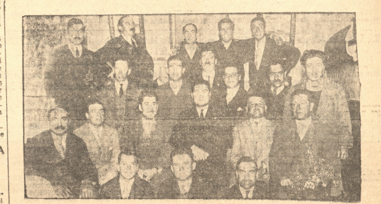
ASISTENTES A LA CENA DE LOS PROPIETARIOS DE AUTOBUSES DE CONCEPCION Y TALCAHUANO

Celebraron con una sesión y cena su fusión en una sola entidad