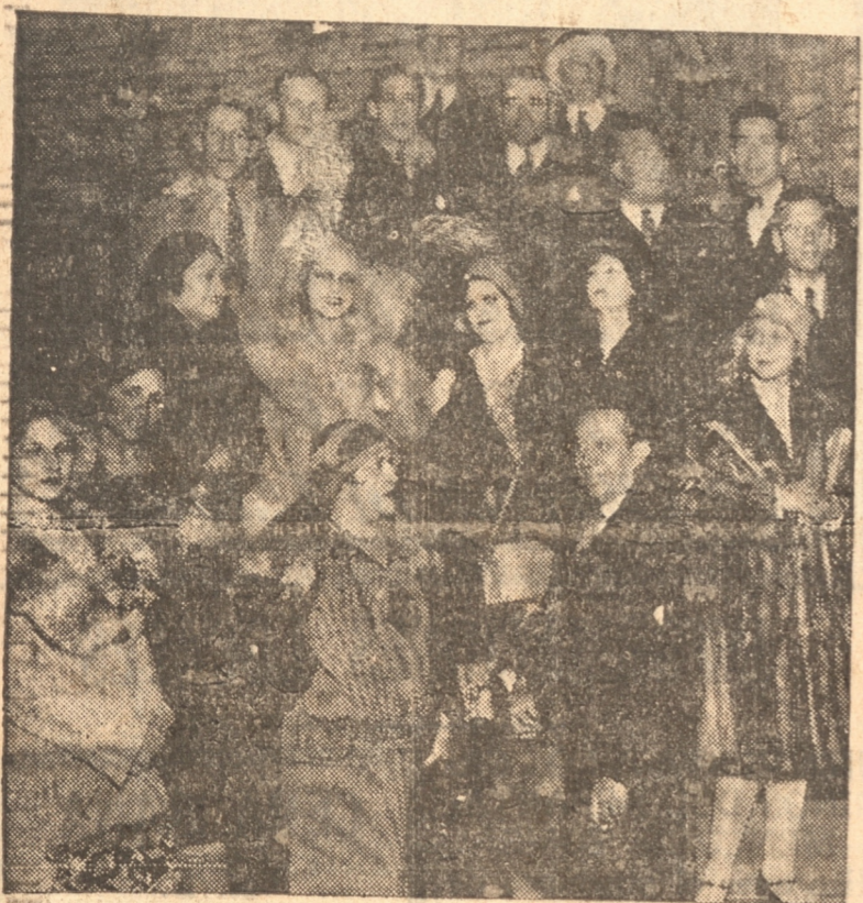
GRUPO DE ARTISTAS DE LA COMPANIA CALVET ANOCHE DURANTE EL ENSAYO

Un género nunca visto en Concepción. — Valioso decorado expresamente confeccionado para el género. — Elenco especializado en el género y de los más numerosos que nos han visitado. — Temporada a base de estrenos y precios populares