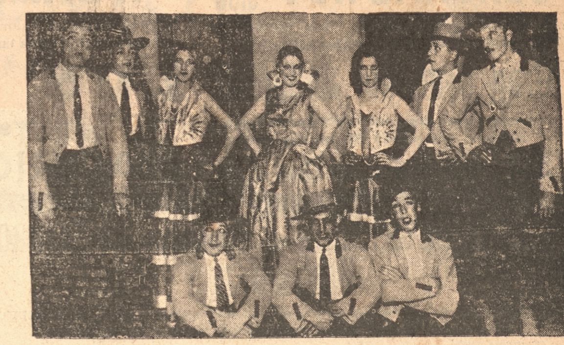
GRUPO DE LOS CUADROS MAS CELEBRADOS DE "LUZ, MUSICA Y COLOR"

Los grandes nombre humillan y no ensabian a los que no saben mantenerlos. HOY Santos Facundo y Primitivo MANANA San Gregorio III