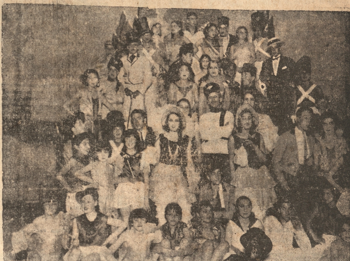
UN GRUPO DE LOS AFICIONADOS DE TALCAHUANO QUE ACTUAN EN LA REVISTA "LUZ, MUSICA Y COLOR", DE MOLINA LA HITTE, REPETIDA AYER EN EL CONCEPCION CON EL MISMO EXITO DE LA PRESENTACION