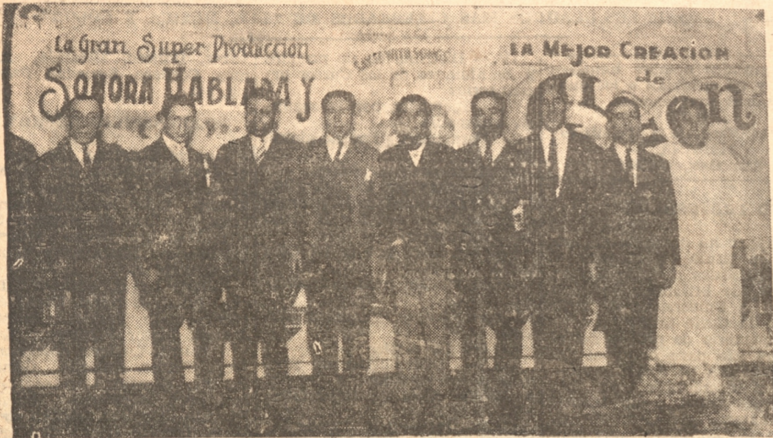
EL PERSONAL DEL TEATRO CENTRAL QUE TENDRÁ SU BENEFICIO

Buenas películas se exhibirán.— Estrenos absolutos para Chile.— Doce profesores de orquesta darán mayor brillo a este beneficio