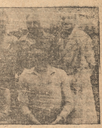
Los locales ofrecieron en su