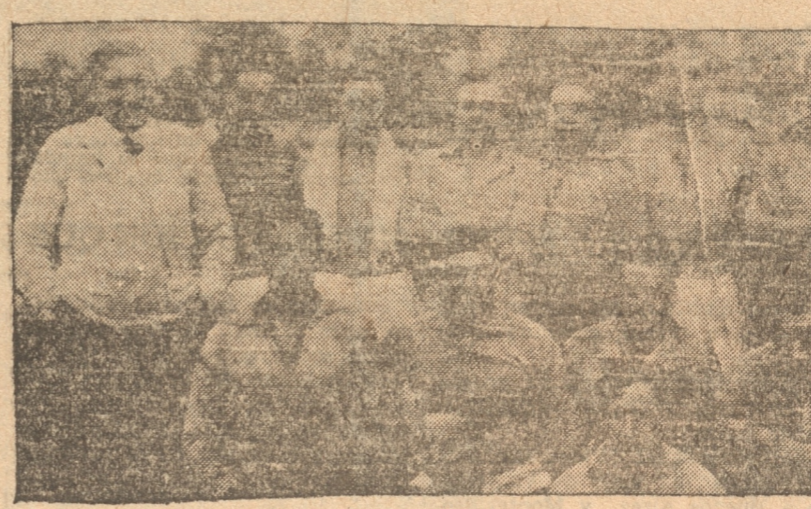
LORD COCHRANE, ACTUALM ENTE EL UNICO EQUIPO PEN QUISTA, QUE REALIZO AYER MERITORIA PERFORMANCE