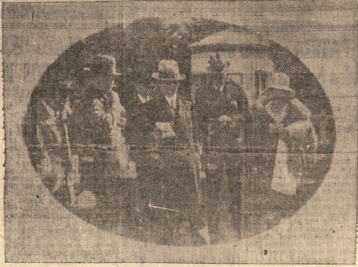
Comentando una de las pruebas de la tarde