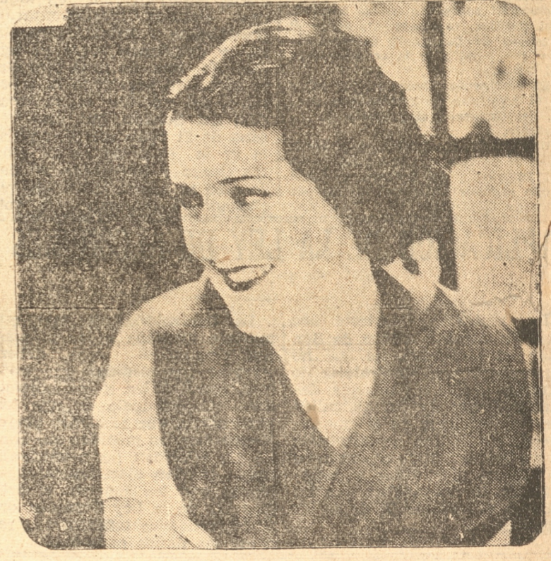
IMPERIO ARGENTINA. Hace una creación en "La Hermana San Sulpicio"

Imperio Argentina, la gentil protagonista de muchas cintas habladas en nuestro idioma, es la intérprete del personaje principal de la pieza, secundada por el cómico Miguel Ligero, de grato recuerdo por su destacada actuación en películas hechas por Paramount y Fox en Francia y Estados Unidos, respectivamente.