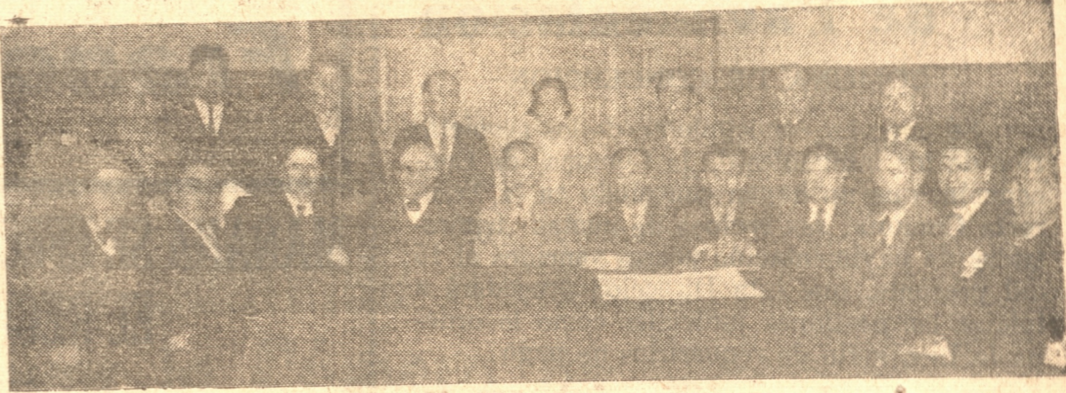
DIRECTORIO DE LA SOCIEDAD DE PELUQUEROS "LA UNIÓN", SENTADOS. — DE PIE, LOS SOCIOS PREMIADOS POR LA SOCIEDAD

El domingo se pondrá término a estas festividades con un paseo campestre a la desembocadura del Bio Bio