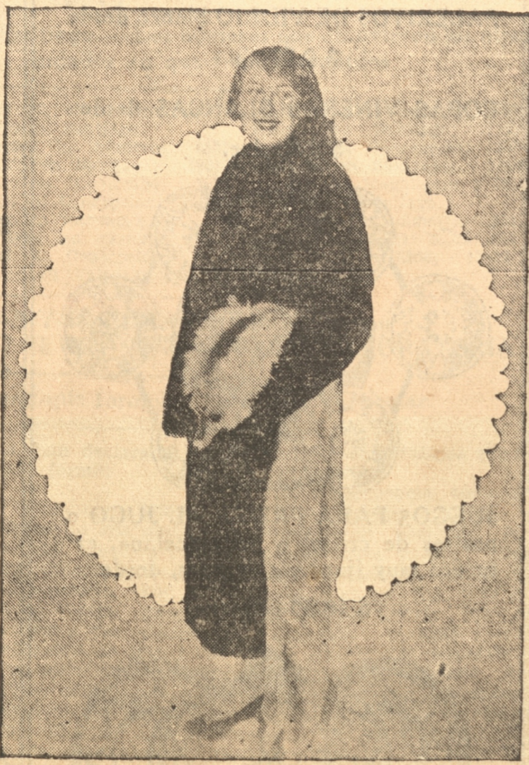
EL ABRIGO DE PIEL DE NUTRIA QUE SORTEA "LA PATRIA"

Para poder obtener un cupón numerado, es necesario enviar uno de los cupones que aparecen en nuestro diario, adjuntando un peso en estampillas. Para nuestros lectores de provincia, mantendremos una especial atención y solamente les rogamos que conjuntamente