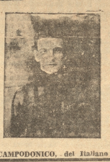
CAMPODONICO, del Italiano

20. Carrera. Final de novicios, perdedores.