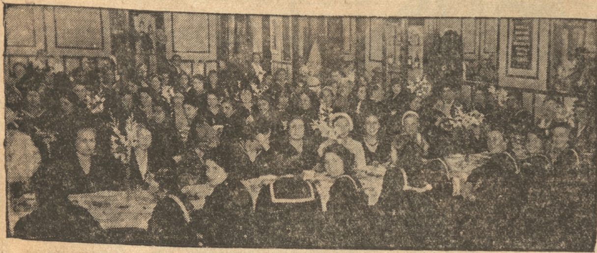
ASISTIERON AL TE OFRECIDO AYER A LAS ALUMNAS DEL VI AÑO DEL LICEO FISCAL DE NIÑAS

En la tarde de ayer, las alumnas de los V años del Liceo Fiscal de Niñas ofrecieron una simpática manifestación en honor de sus compañeras de los VI años que están próximas a finalizar sus estudios.