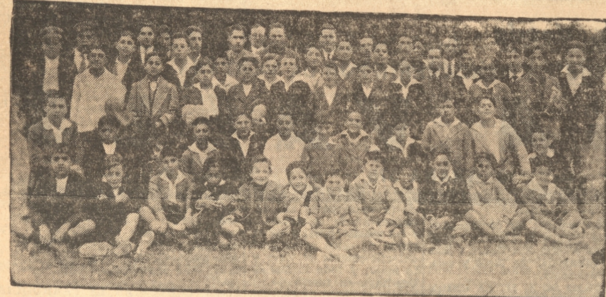
ALUMNOS DEL COLEGIO DE SALESIANOS QUE ASISTIERON AL PASEO DE AYER

Lo efectuaron ayer al fundo "Hualpencillo"