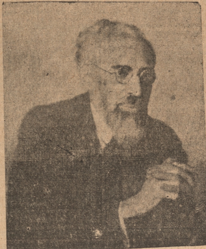
Prof. Dr. Alejandro Lipschutz Director del Instituto de Fisiología de la Universidad de Concepción que ha sido separado de su cargo

En los círculos universitarios de nuestra ciudad se han comentado de diversas maneras las incidencias que han culminado con la separación del profesor Lipschutz de su cargo de Director del Instituto de Fisiología. Se deplora su alejamiento del puesto que hasta ahora ha desempeñado y, al mismo tiempo, se considera que el acuerdo del Directorio es acertado, desde el punto de vista en que este organismo se ha colocado para apreciar la situación.