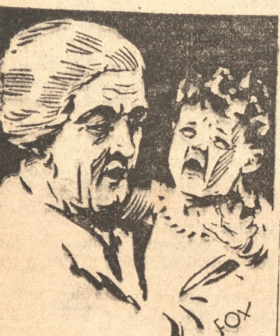
La diarrea y sus causas.

Pero, entretanto, si América Latina no existe para Hollywood como fuente productora de elementos, existe si como mercado productor de muchos dólares. Y ya es tiempo que nuestros países de mostren su riqueza de elementos artísticos e intelectuales, y que exijan, en la confección de películas habladas en español que en Hollywood se hacen, el sitio que a nuestro continente, poderoso y libre, le corresponde en esa producción que somos casi los únicos que vamos a co-