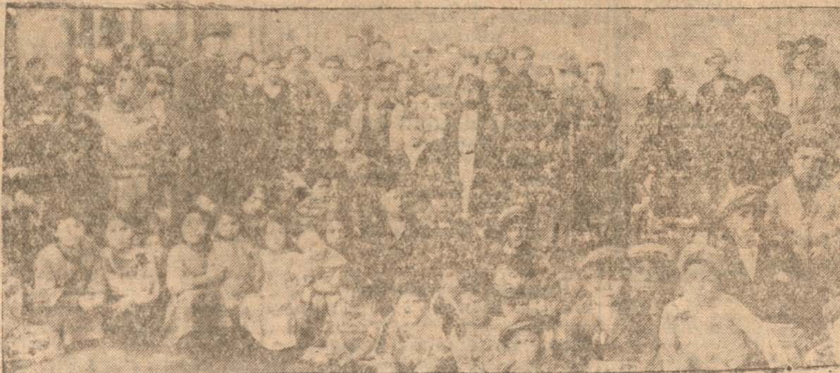
UN GRUPO DE NIÑOS DEL ALBERGUE QUE SON ALIMENTADOS CON LA OLLA QUE SOSTIENE EL OBISPADO DE LA DIOCESIS