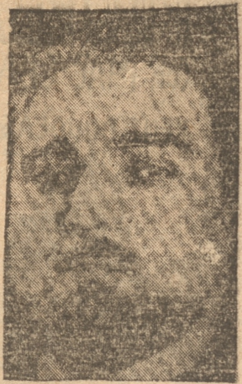
SIG. DINO GRANDI, ministro de Relaciones de Italia y que hizo importantes declaraciones en Lausanne sobre deudas de guerra y reparaciones

LAUSANNE, 5. — (U. P.) — El jefe de la delegación italiana, Sig. Grandi, en una declaración reciente en la reunión