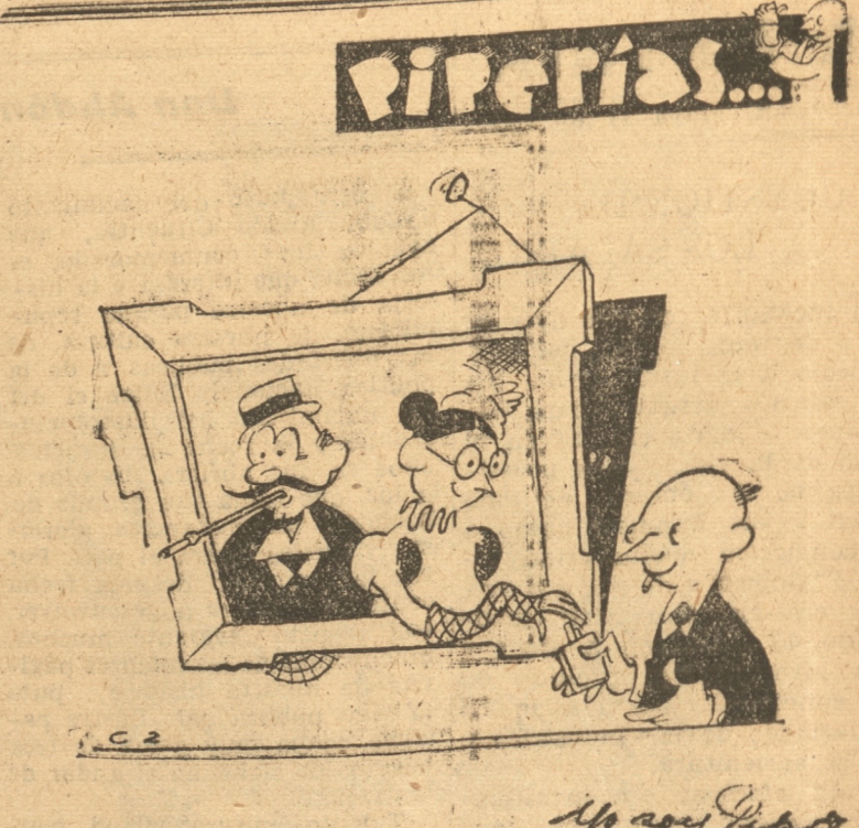
FUMAN LOS ANTEPASADOS... POPULARES ovalados

Como lo ha dicho muy bien el Ministro de Agricultura, el encarecimiento de los artículos agrícolas no proviene de la excesiva liberalidad en las exportaciones, pues la Junta ha velado en todo momento porque el país disponga de stocks necesarios para su abastecimiento. Una política drástica de prohibición de exportar todos los productos alimenticios además de ser inútil crearía en el país una situación insostenible que paralizaría el intercambio, que deprimiría aún más nuestra moneda y llevaría a límites exorbitantes los precios de muchos artículos de primera necesidad que Chile está obligado a importar del extranjero, como el arroz, el azúcar, el aceite, el café, etc.