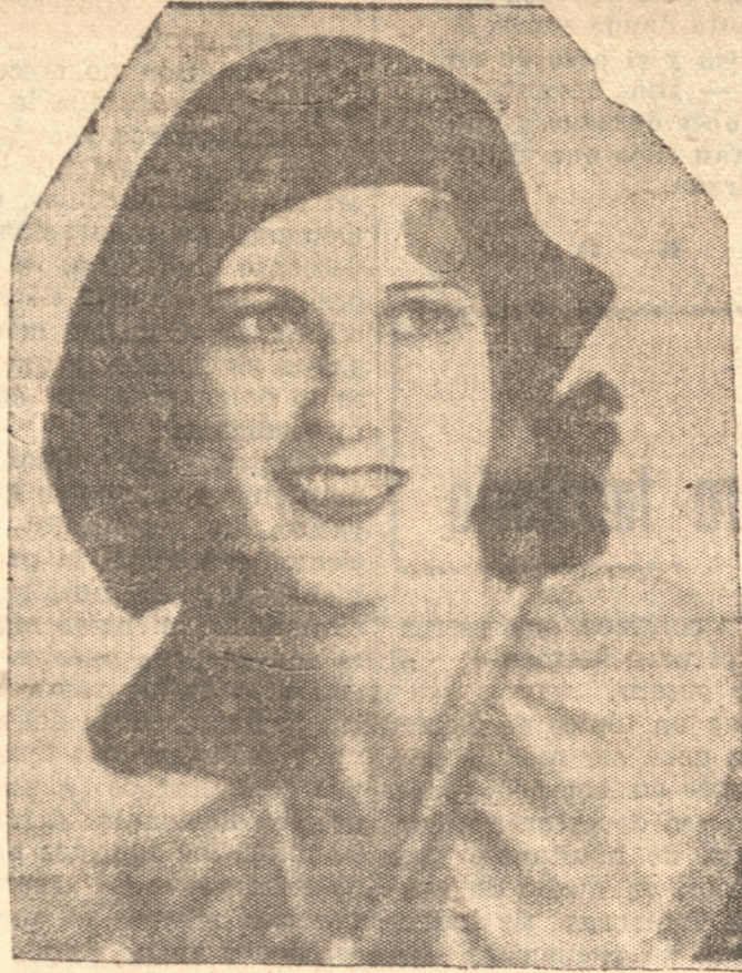
Y que sirvió para inaugurar el magnífico Teatro Spléndido de Santiago

aqué aseguraba, había prometido actuar el actor cowboy mediante un contrato que significaba un salario semanal de 12.000 dólares, más una serie de comodidades, tales como un vagón especial para él y su caballo Tony durante los viajes del circo de una ciudad a otra. Entre tanto, Tom Mix estuvo apareciendo en el Sells Flotow Circus, empresa competidora de aquella otra, siendo esta la causa de que Miller entablase un juicio por daños y perjuicios contra Mix, por incumplimiento de contrato; mientras Mix a su vez, le acusaba de daño moral por el hecho de haberle semejante acusación. La justicia acaba ahora de fallar en favor de Mix, estableciendo que los documentos que tenía con Miller no significaban un contrato y que por lo tanto estaba en el derecho de irse con cualquier otra empresa, a pesar de que Miller tuvo como principal testigo a la ex esposa de Mix, quien declaró que, efectivamente, su esposo, había dado su palabra de actuar para el circo de Miller. En vista de todas estas dificultades, y a pesar de haber ganado el pleito, Mix ha asegurado que abandona definitivamente la vida de circo, a la que no piensa volver, habiendo mostrado dos telegramas de grandes productores de Hollywood ofreciéndole magníficos contratos para volver aquí a filmar películas habiadas.