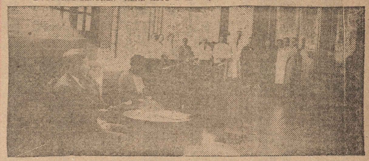
PERSONAL MEDICO Y ADMINISTRATIVO