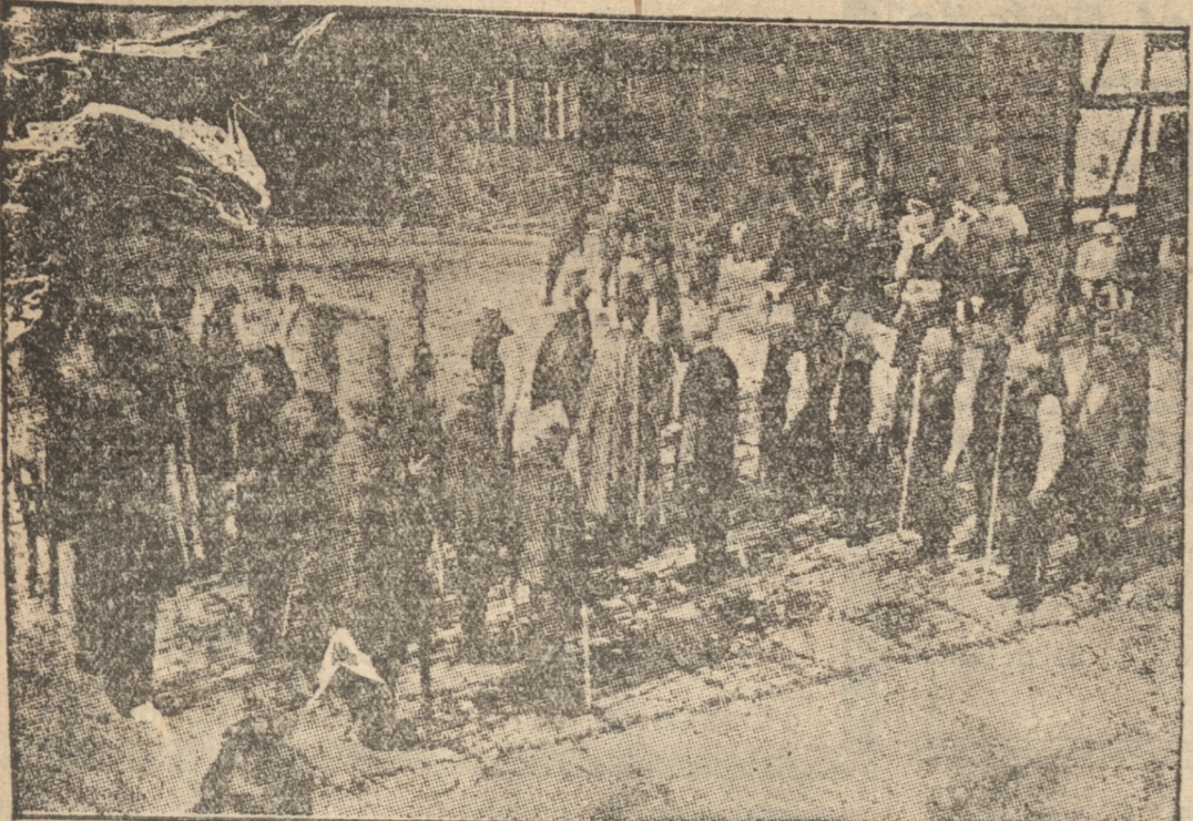
SOBRE UN GRAN TABLE RO, PIEZAS "HUMANAS" EN UNA FIESTA TIPICA

premios a los campeones. Este acontecimiento se celebra con numerosas fiestas de carácter popular, entre las cuales la más pintoresca y tal vez la más original consiste en jugar una partida de ajedrez sobre un enorme tablero trazado en el suelo, estando las piezas representadas por seres humanos. Muchos son los forasteros que acuden a la ciudad para el Festival del Ajedrez y participan en las procesiones y desfiles que se realizan en honor del antiquísimo pasatiempo. Existe también otra costumbre que demuestra el espíritu conser-