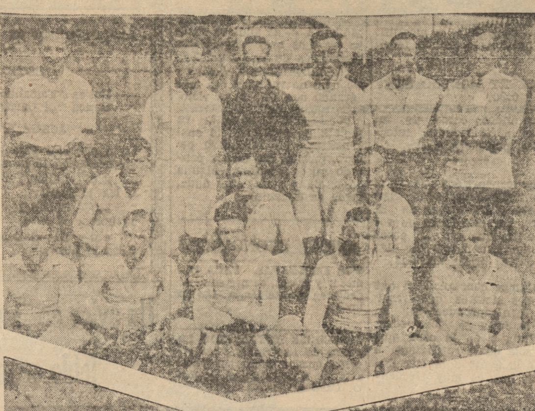
LOS INGLESES QUE HICIERON AYER UNA BUENA PRESENTACION