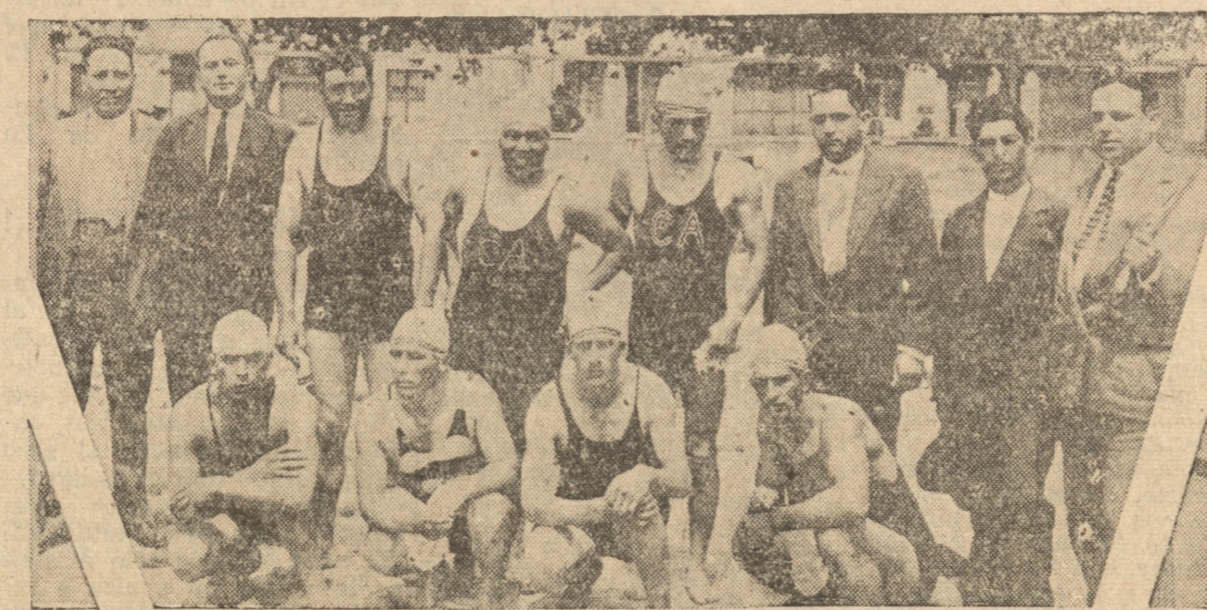
Nuestro redactor deportivo en Talcahuano y los organizadores es de la competencia y equipo del "Centro Cultural Académico"

Con el resultado de los partidos jugados, la competencia que se desarrolla por puntos, hará que el próximo