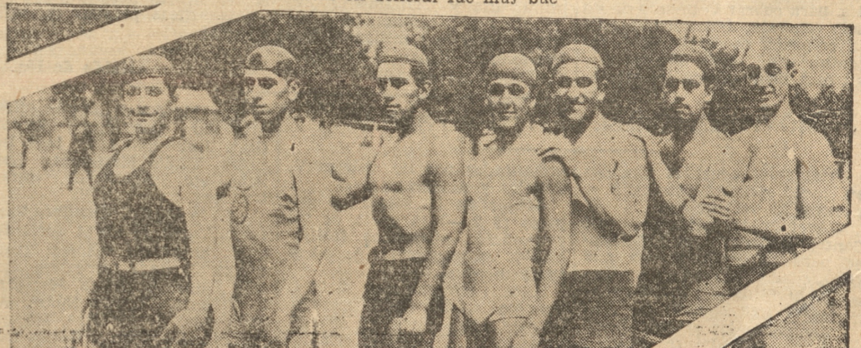
EQUIPO DEL GOLD CROSS (Ganador)

Se corrió a la distancia de cincuenta metros entre infan-