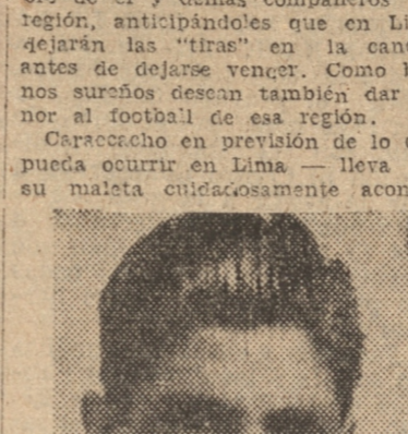
AVENPAÑO.— Buen ágil del Magallanes.

Magallanes jugará en el Perú cinco partidos y percibirá la suma de diez mil pesos por match. Corren de su cuenta los viajes y salarios de los jugadores, calculándose que a su regreso quede a la institución una utilidad líquida de 20 mil pesos. EL PRIMER MATCH ES DIFÍCIL El primer match lo jugará el 28 del mes en curso frente al Universitario, reciente vencedor del Allianza de Lima por la cuenta de 2-1. El segundo será con el once de los "in tiempos", el tercero con una selección chilena, el cuarto y quinto reanchará con Universitario y Alianza.