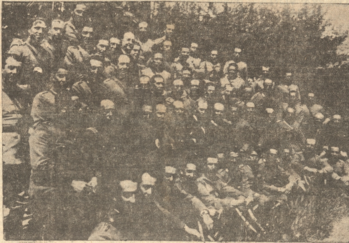
ASISTENTES AL ALMUERZO EN EL CASINO DEL REGIMIENTO CHACABUCO

"He tenido verdadera satisfacción al agradecer a esta ciudad su actuación en horas difíciles"