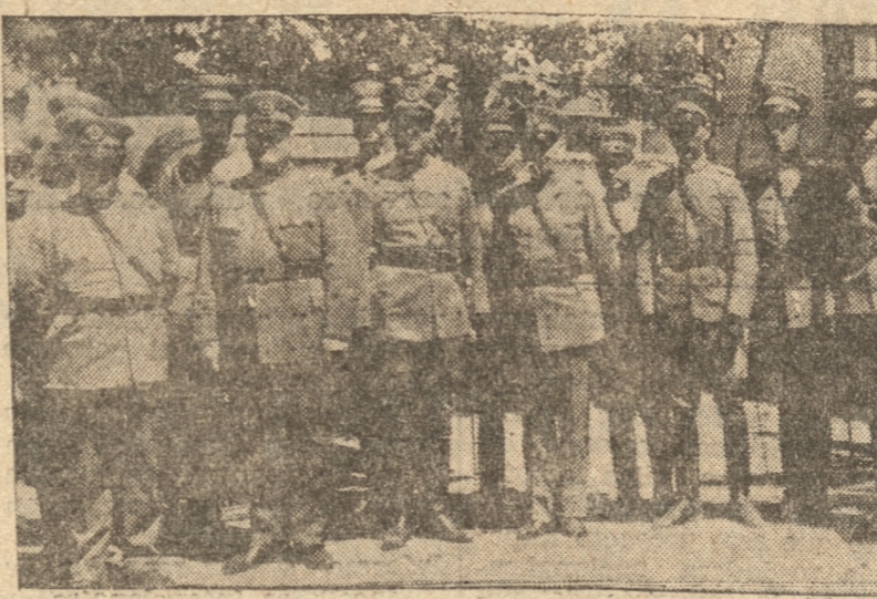
El Ministro en pose para la "PATRIA" en el Batallón Tren.

Se levantó nuevamente el señor Ministro de la Guerra pa-