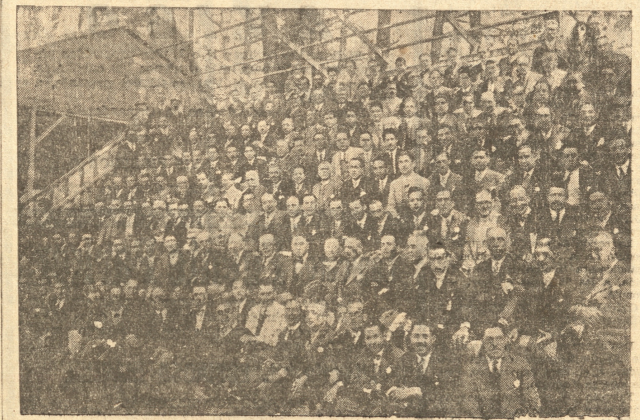
LOS ASISTENTES DEL PASEO EFECTUADO ANTEAYER POR EL PARTIDO RADICAL AL LOCAL DE EXPOSICIONES DE LA QUINTA AGRICOLA