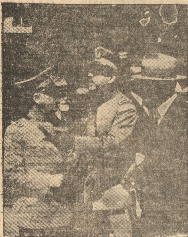
El general Novoa conversando con el general señor Saez.