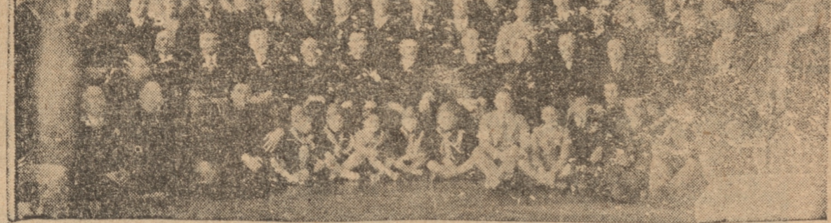
UNA VISTA DE LA CONCURRENCIA AL ACTO VERIFICADO AYER EN LA CATEDRAL.

Con profunda emoción oyó el público la pieza oratoria del capellán de Apostadero, que ha consagrado una bella oración sobre la Persona Divina de Jesucristo.