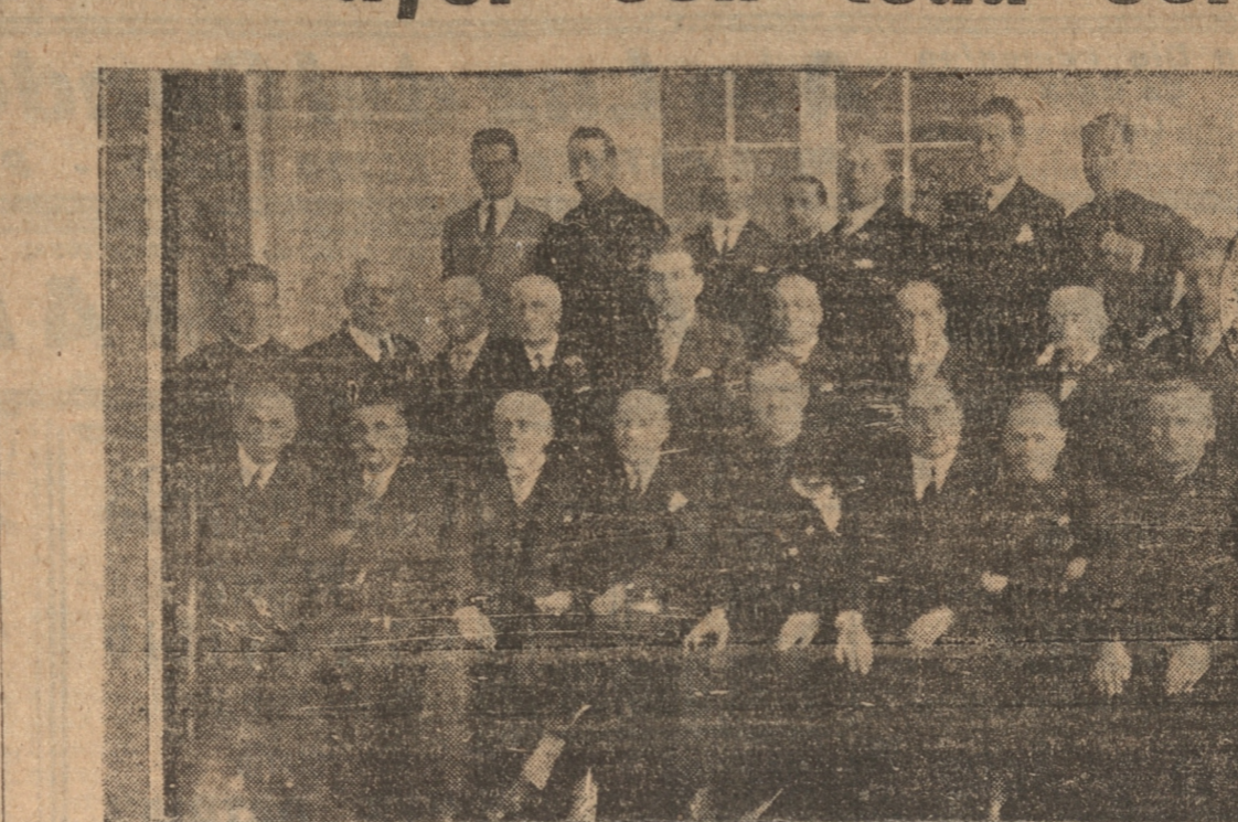
Grupo general de Asistentes el Spumante D'Onore en la Casa Degli Italiani