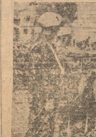
Los cadetes milicianos prestando su juramento

una descarga hecha por una sección de fusilería.