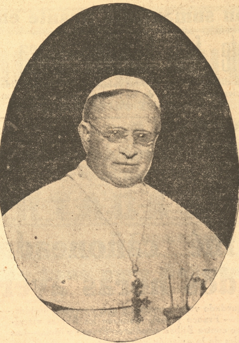
S. S. el Papa Pío XI, glorioso reinante, que en el día de hoy, en que cumple 80 años de vida, recibirá el homenaje de todos los católicos del mundo que elevarán sus preces al Cielo para que prolongue por mucho tiempo más tan preciosa existencia.