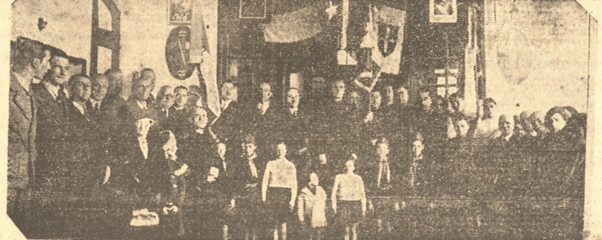
El Colegio de Italia y personas que presidieron las festividades de ayer en el Colegio Salesiano

En el Colegio Salesiano, Parroquia Italiana se verificaron ayer diversos actos en honor de la Patrona del establecimiento, María Auxiliadora, con cuyo motivo se desarrolló un programa de actos religiosos y sociales que se cumplió con gran entusiasmo.