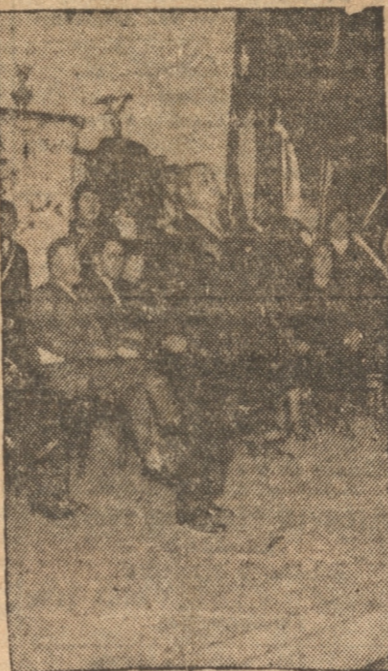
Los visitantes, a su llegada, en la Estación de los FF. CC. Antes del almuerzo obrero en el Hotel Zehnder. Arriba, Durante la Asamblea en el Teatro Rialto. ...

A las 13 horas se verificó en el Hotel Zehnder el almuerzo que