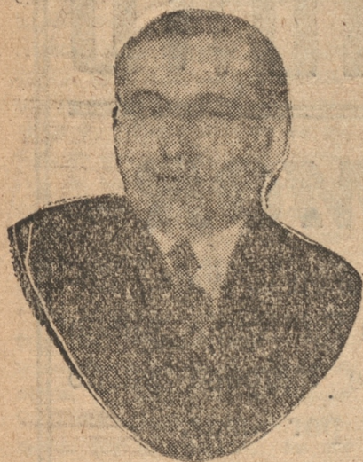
Excmo. señor don Arturo Alessandri Palma Es el Generalísimo de las Fuerzas de Mar, Aire y Tierra

Celebra hoy el Ejército de Chile el día de sus glorias. Consagrado ha sido este 19 de septiembre para que en todo el país, a lo largo de nuestro territorio, se recuerde el heroísmo del Ejército chileno que ha sabido cubrir de tanta gloria sus escarapelas.