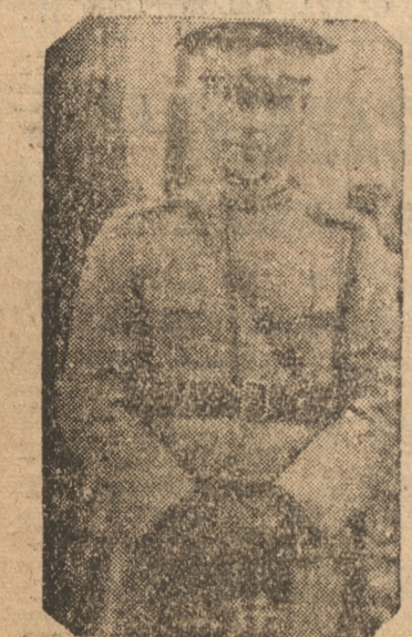
Jefe Accidental de Estado Mayor Cap. Sr. Rogelio Soto