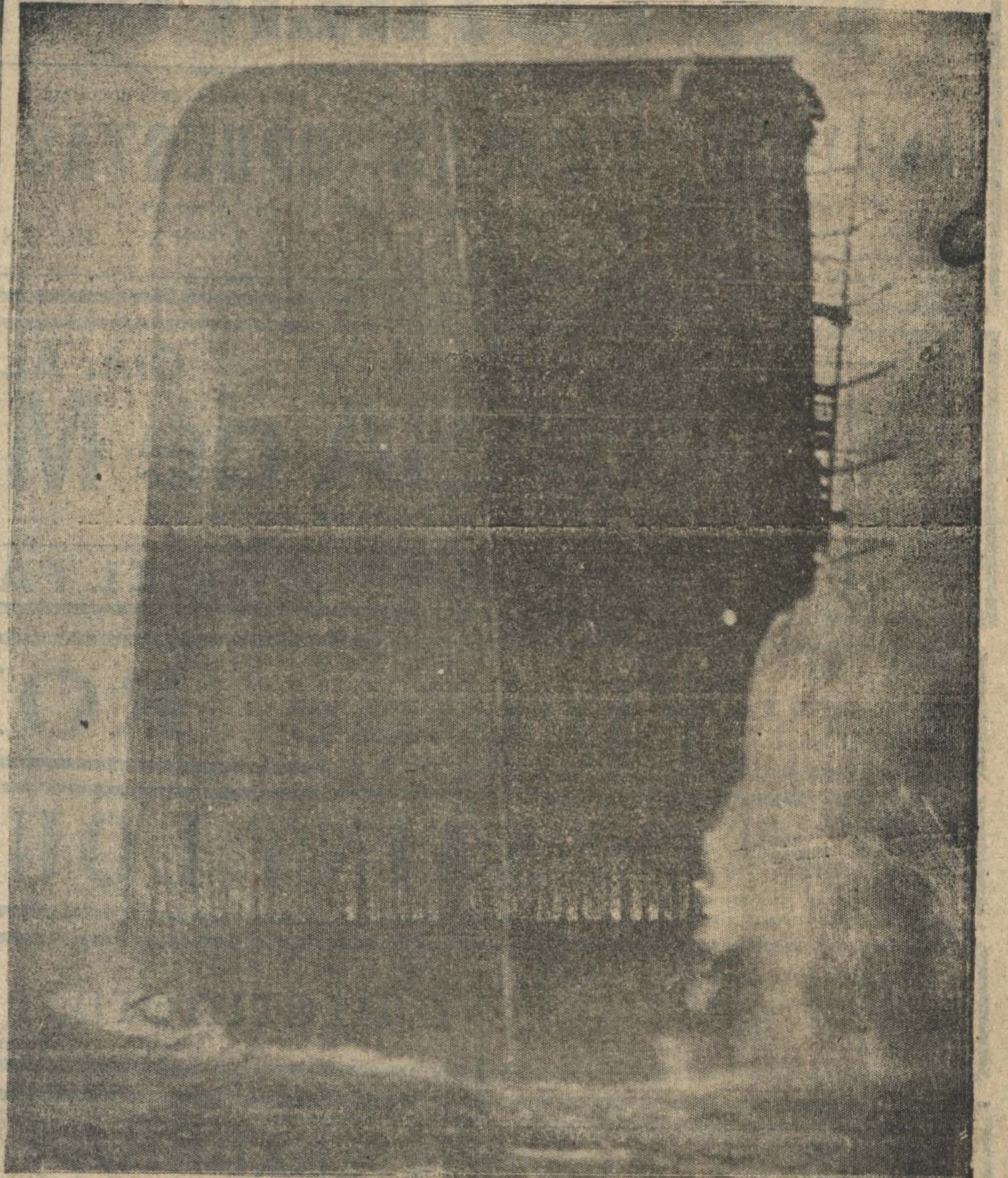
Hundimiento de un torpedero inglés en alta mar. Es curiosa la posición del barco ya a medio sumergir y con popa en alto.