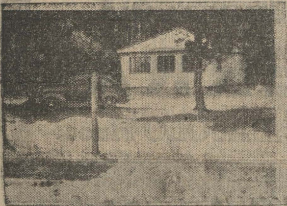
Refugio que el Automóvil Club de Concepción ha construido en Cerro Verde, y que será inaugurado el domingo próximo.

los, entre ellos se cuenta el refugio que pronto se inaugurará, el heroseamiento de los terrenos con que cuenta, y el servicio de hotel que está en pleno funcionamiento, todos los días, para los socios y con precios que son sumamente bajos. El Auto Club, preocupado por la comodidad de sus socios fijó al concesionario los precios que podría cobrar, y son los siguientes: Almuerzo o comida $ 7.— PLAN DE TRABAJOS Con el objeto preciso de llevar a feliz término los trabajos hasta ahora realizados, el Auto Club se ha trazado un plan de trabajos en el que se contemplan los siguientes puntos, entre otros: Instalación de un pequeño hotel con baños de mar, cafeterías, para los socios. Solicitar de la Municipalidad la concesión de estacionamientos para los automóviles de los socios del Club, y con-