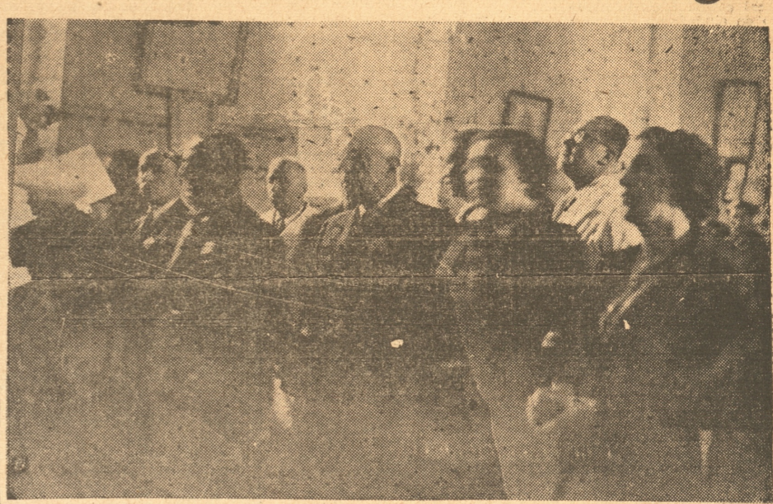
Durante el acto íntimo celebrado ayer en el Hospital