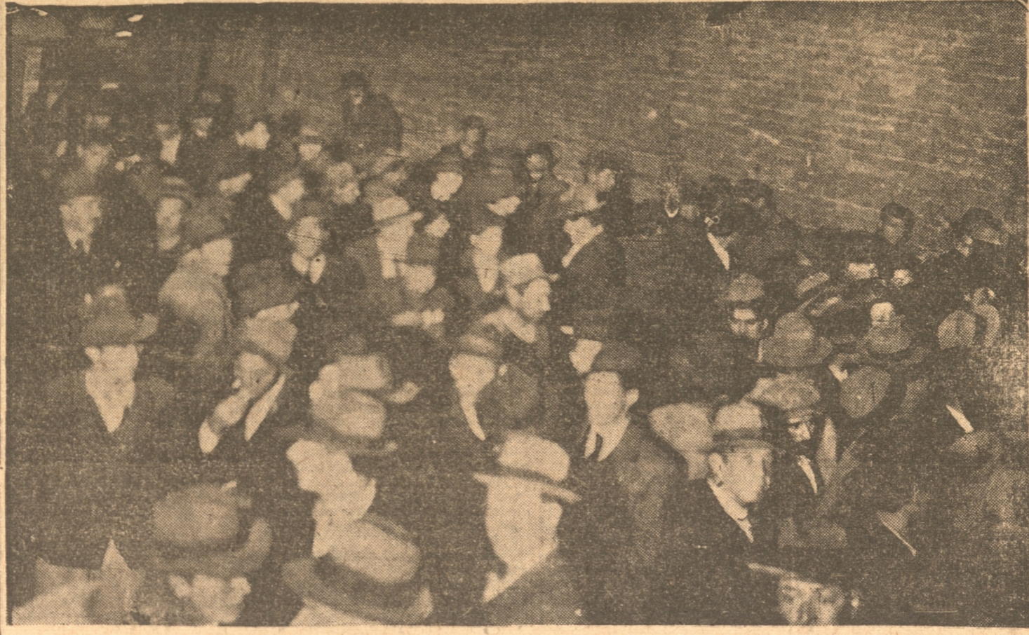
PARTE DE LA CONCURRENCIA A LA PROCLAMACION DEL CANDIDATO NACIONAL POR EL PARTIDO LIBERAL DE ESTA CIUDAD.

ECOS DE LA PROCLAMACION DEL CANDIDATO NACIONAL EN CAÑETE. Como dijimos ayer, la proclamación en Cañete fué sencillamente una apoteosis, pudiendo agregar ahora, que la asistencia a esta proclamación fué de un número superior a mil quinientas personas.