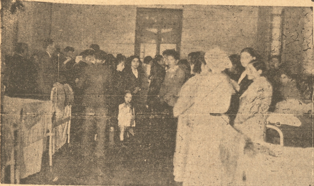
Otro aspecto de la celebración del Día del Hospital