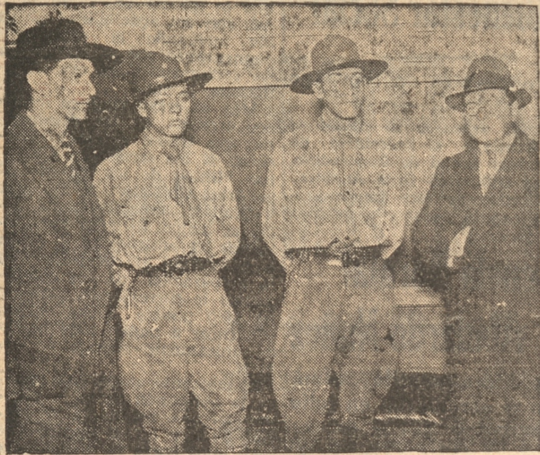
LOS SCOUTS COLOMBIANOS A SU LLEGADA A LA ESTACION

En el día de hoy, los scouts colombianos, atendidos por la comisión que nombró el Comisionado Provincial, visitarán en la mañana de hoy a las autoridades de la provincia, a las autoridades scoutivas, y ensegui-