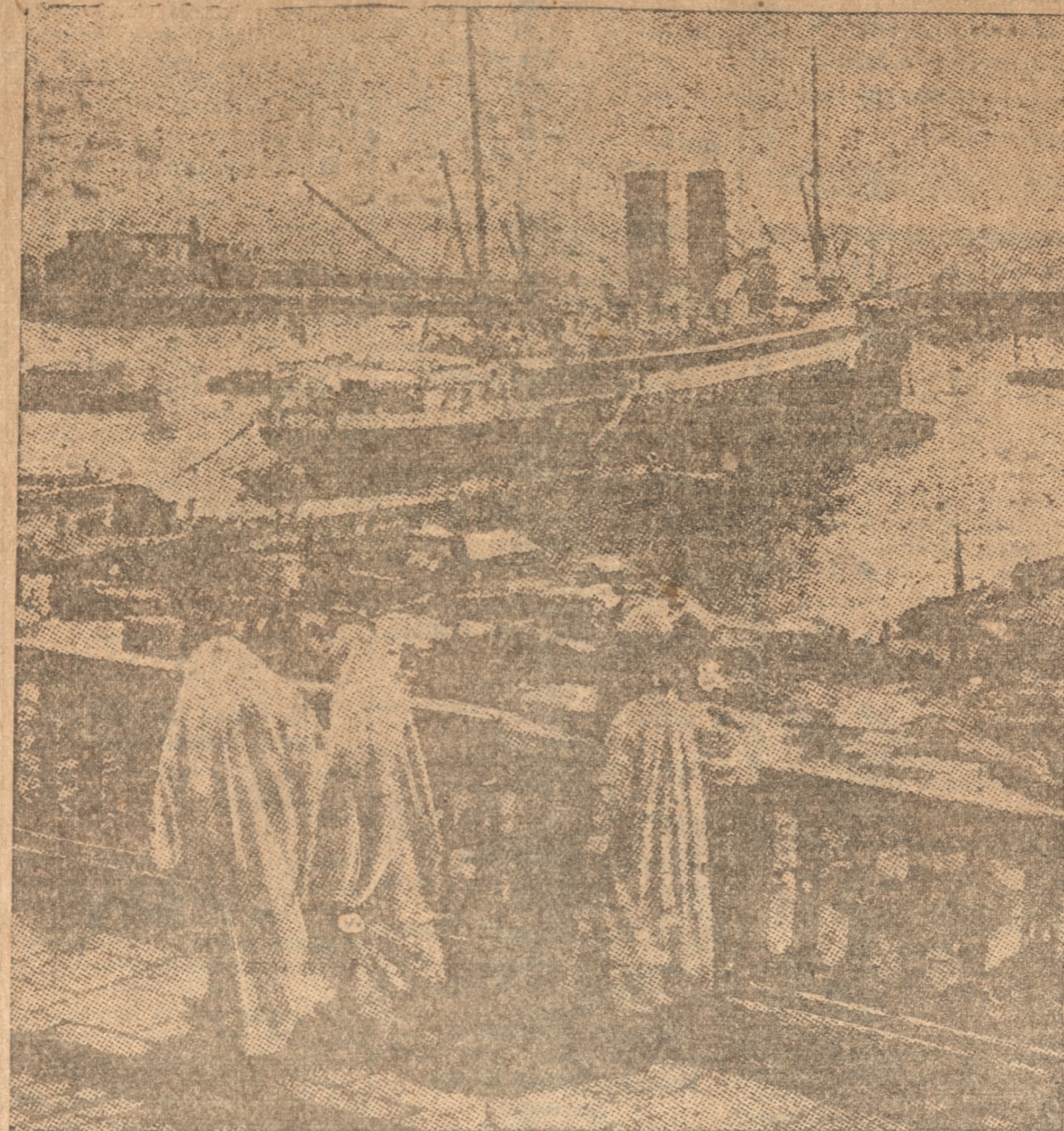
UN BINCÓN DEL BULEVAR DE LA REPUBLICA, DE LA CIUDAD DE ARGEL. PASEO PREFERIDO POR LOS HABITANTES DEL LUGAR, Y DESDE EL CUAL PUEDE CONTEMPLARSE EL PUERTO EN TODA SU EXTENSION

Por una oscura callejuela aparecen dos figuras femeninas vestidas de blanco y velado el rostro, del cual sólo quedan visibles los ojos, obscuros, luminosos y de suave