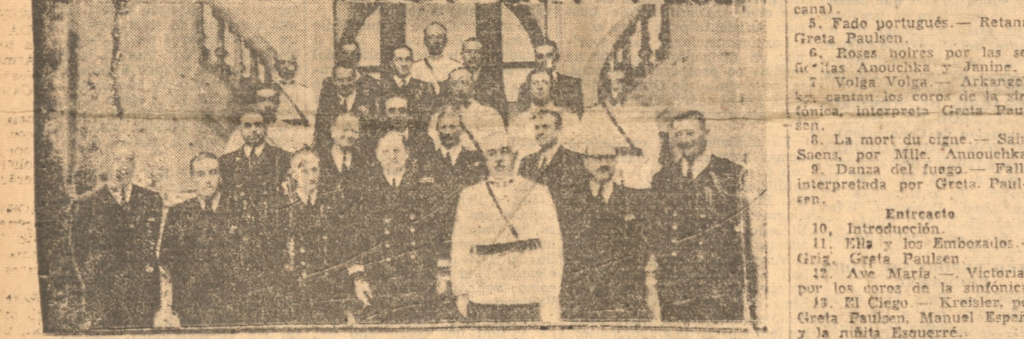
ASISTENTES AL ALMUERZO DE AYER EN EL CLUB CONCEPCION