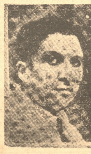
Coronel Rafael Franco, a quien se llamó nuevamente a Paraguay

ASUNCION, 8. — (UP). — (Flash). — Fuerzas de marinería atacaron a las fuerzas sublevadas ocupando la ciudad.