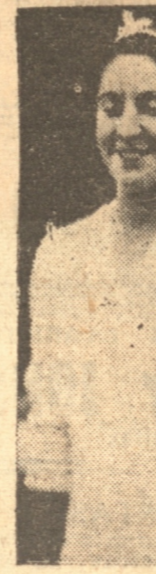
Anita Lizana que volvió a triunfar en EE. UU.

Los expertos estiman que tiene buenas perspectivas de vencer a su magnífico juego desde la línea de base, tanto con foreh and como en las revéses que constituyen el fuerte de la norteamericana.