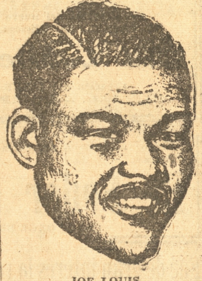
JOE LOUIS El campeón