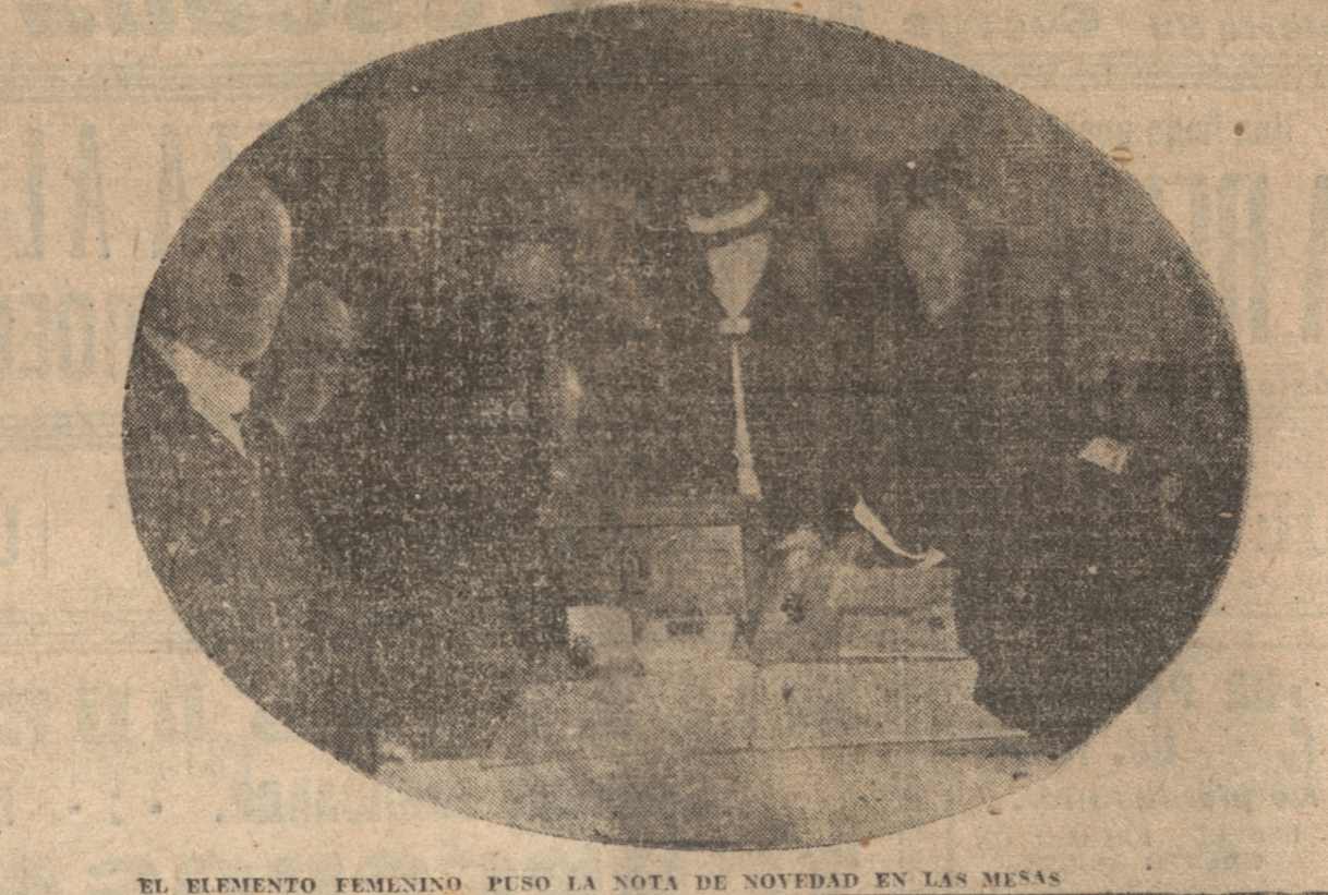
EL ELEMENTO FEMENINO PUSO LA NOTA DE NOVEDAD EN LAS MESAS