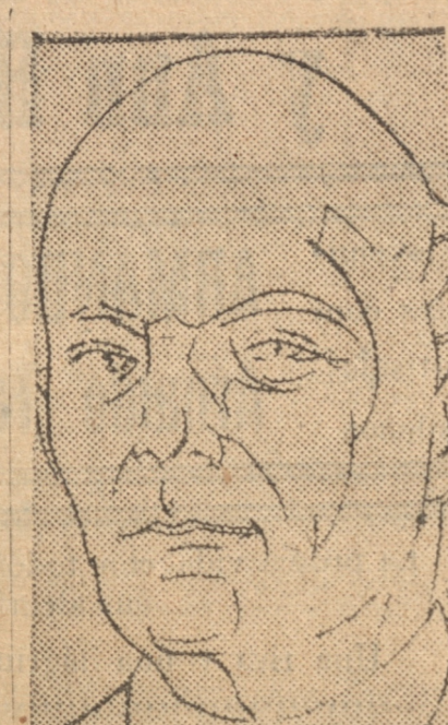
EL MINISTRO SEÑOR ROSS TRATARÁ CUESTIONES COMERCIALES EN PARIS

El total de la población trabajadora de Chile es de 22.1 por ciento que se ocupa en las manufacturas y el 38 en la agricultura.