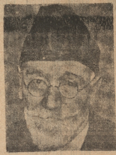
NUEVAMENTE SE TRATARÁ DE LLEVAR A VENIZELOS AL PAIS

Berlin, 5. — (UP). — La Legación de Grecia en esta ciudad una entrevista a un redactor de la United Press y le declaró que dudaba que la revuelta de Creta fuera suficientemente grave como para hacer necesario el regreso del Premier.