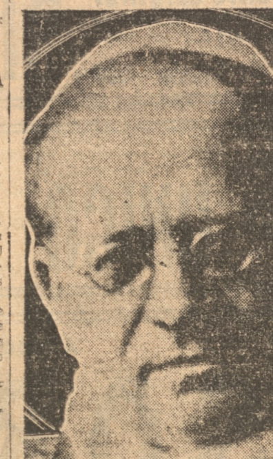
S. S. EL PAPA