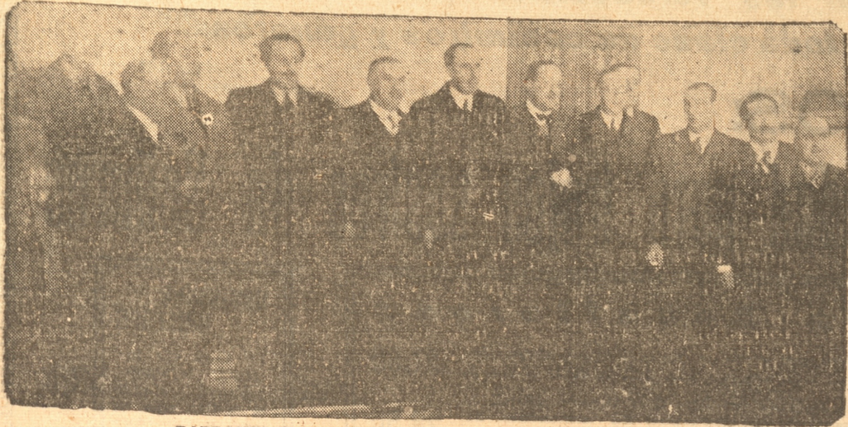
PARLAMENTARIOS Y REGIDORES EN LA MUNICIPALIDAD

Cuestiones son estas que deben tomar en cuenta nuestros representantes, y también la opinión pública de la provincia para cuando lleguen las elecciones para darles el voto sólo a aquellos que cumplan con la palabra empeñada en la solemne asamblea efectuada el sábado en la Alcaldía de esta ciudad, actor en el cual se comprometieron a trabajar unidos por la defensa de Concepción, sin distinción de colores políticos ni banderías.