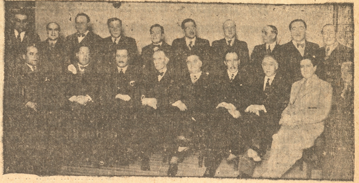
PARLAMENTARIOS, MIEMBROS DEL MUNICIPIO Y COMITIVA EN EL NURIA