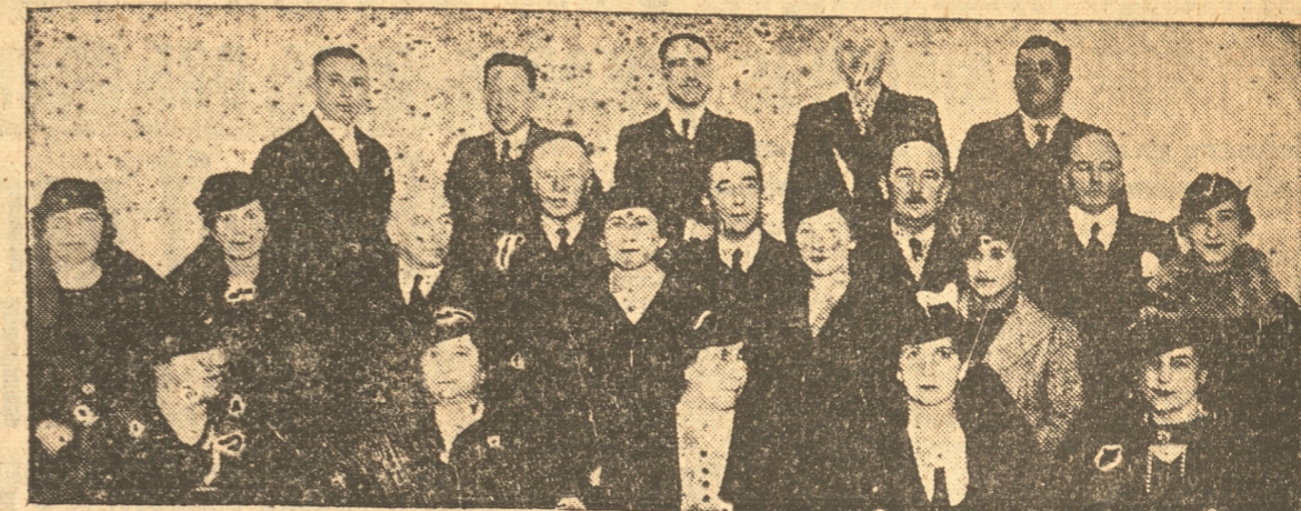
Con motivo de haber cumplido 50 años de existencia la Sociedad Anónima Compañía de Gas de Concepción...