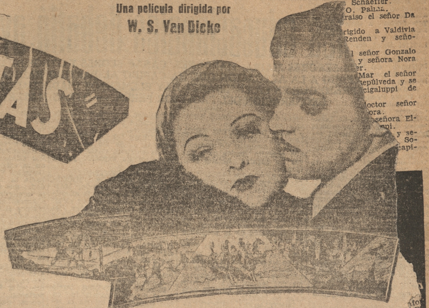
Una tragedia moderna producida por la locura que agita los corazones de las grandes ciudades

Una película dirigida por W. S. Van Dicke